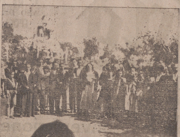
Un momento de la procesion de ayer...