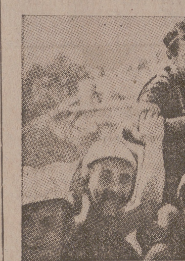
El belga Silverio Maes, campeón de la «Vuelta a Francia», llevado en hombros por un grupo de admiradores, después de su entrada triunfal en París