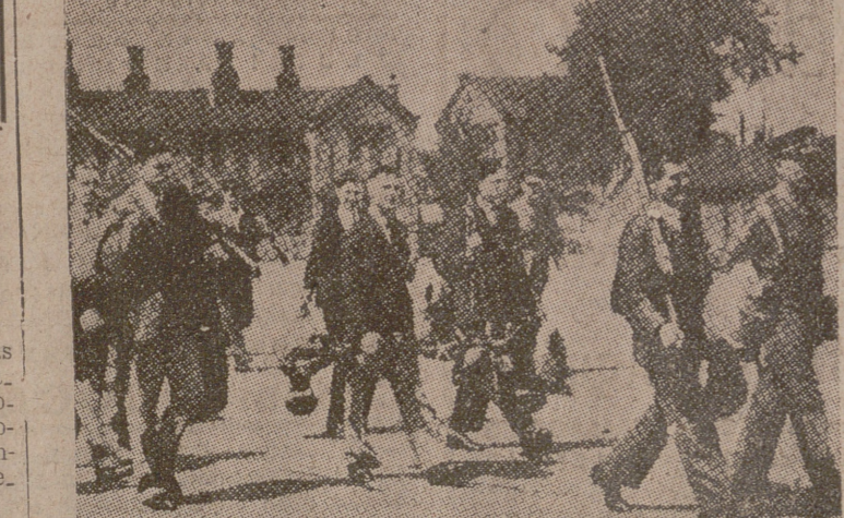
Los reclutas ingleses, que van a cumplir su tiempo en filas, llegan a la Caja de Kensington