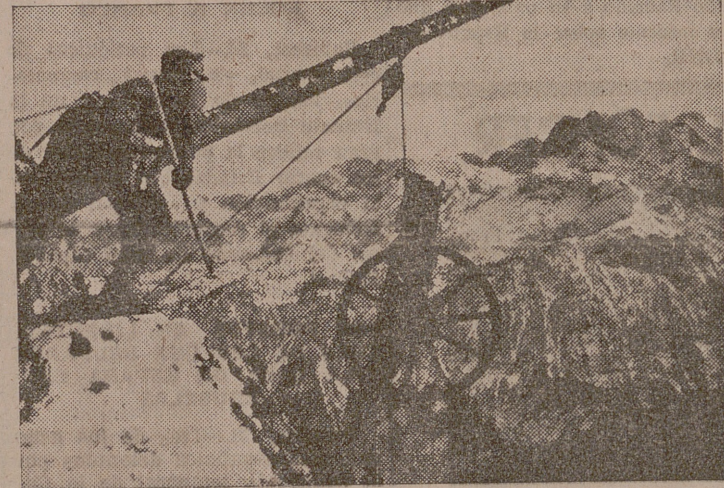
Tropas alemanas de montaña durante las maniobras. Pasando por precipicios profundos, los artilleros de montaña transportan sus cañones para montarlos en posición

Se supone que se trata de una broma pesada.—D. N. B.