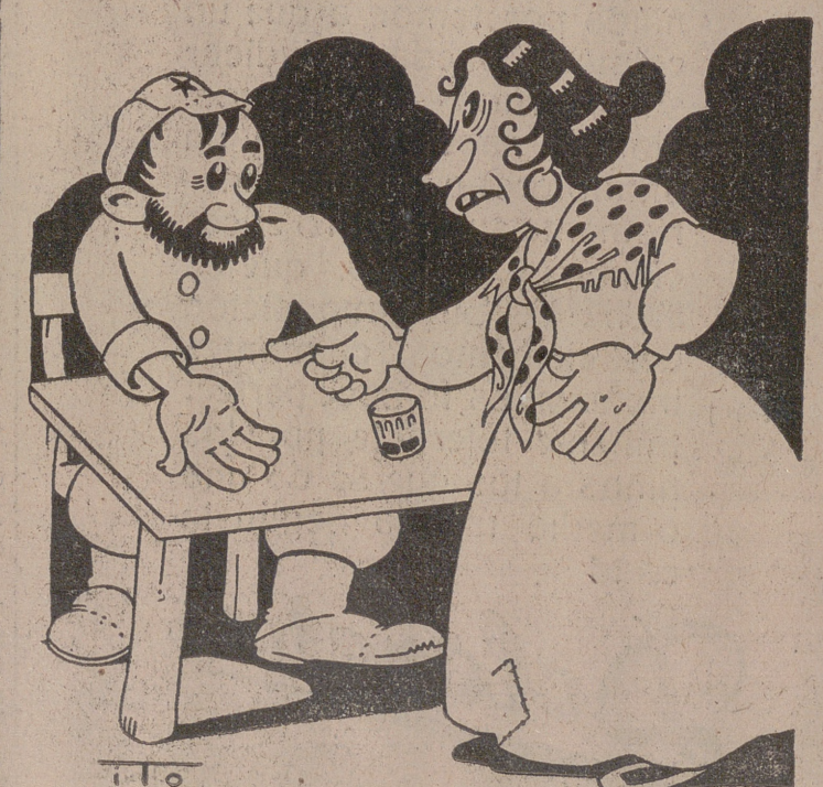
—Por mis churumbales que si ahora es lo eres comisario, llégará un día que toos te saluden. —¿Cuándo? —¿Cuándo te lleven a enterrar, regalao!