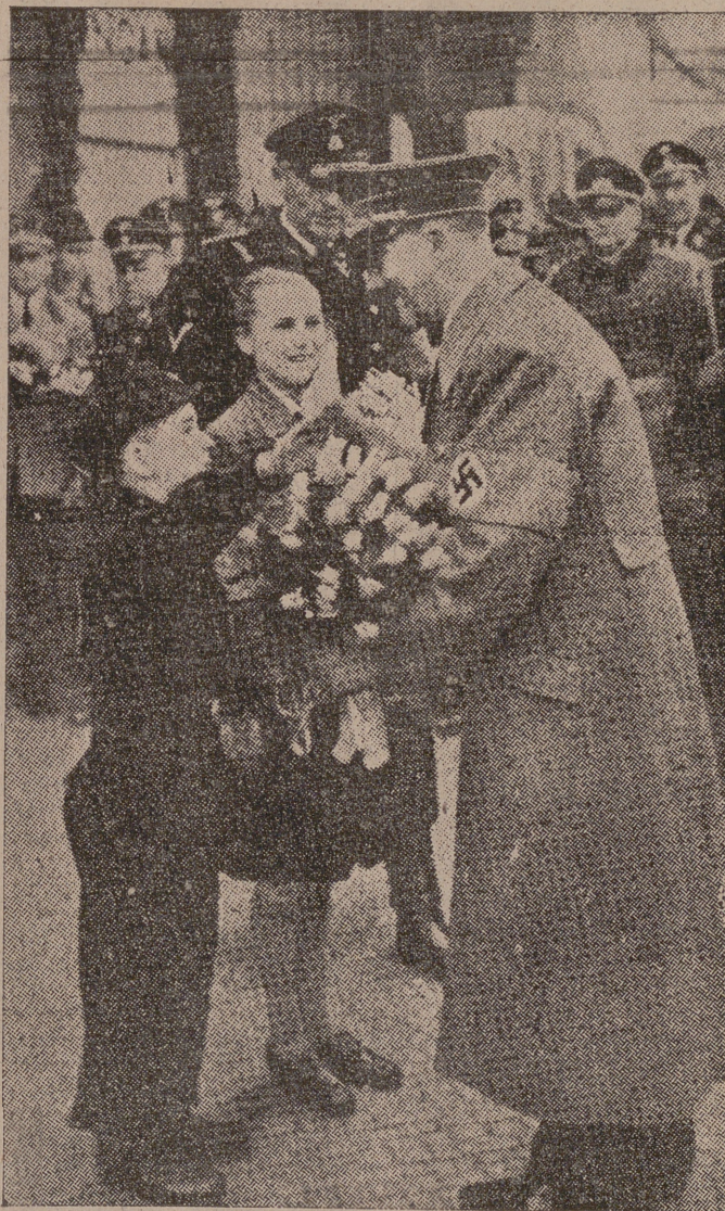
Dos niños de las Juventudes Hitlerianas ofreciendo flores al Führer Canciller del Reich a su llegada a la Exposición del Automóvil de Berlín