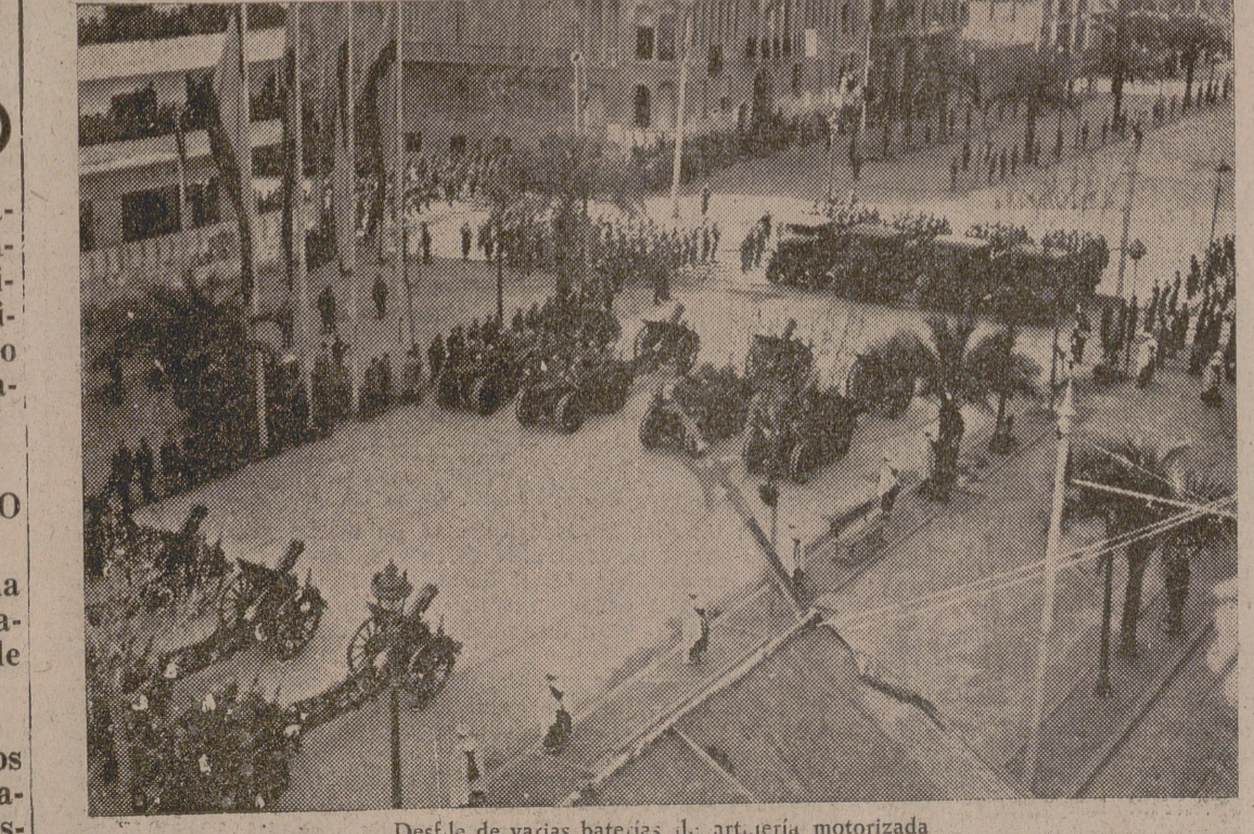
Desfile de varias baterías de artillería motorizada.