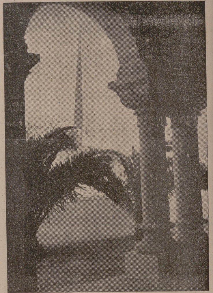
Vista de la plaza de Borne, en la ciudad menorquina de Ciudadela, donde se efectuó el primer desembarco de las tropas nacionales en Menorca.