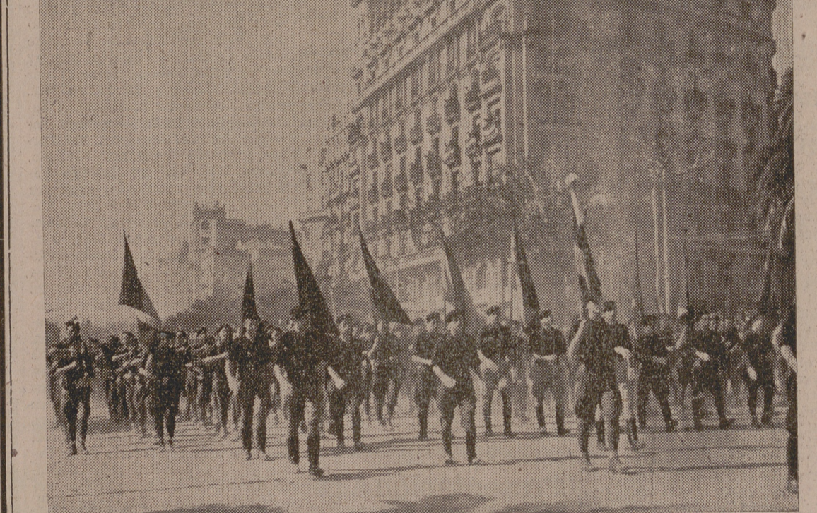
Ante el Generalísimo Franco, en Barcelona, han desfilado cien mil hombres, trescientos carros de combate, trescientas baterías y trescientos aviones de los que han tomado parte en la gran ofensiva de Cataluña. Una Bandera de Falange Española Tradicionalista y de las J. O. N. S., desfilando ante el Generalísimo.