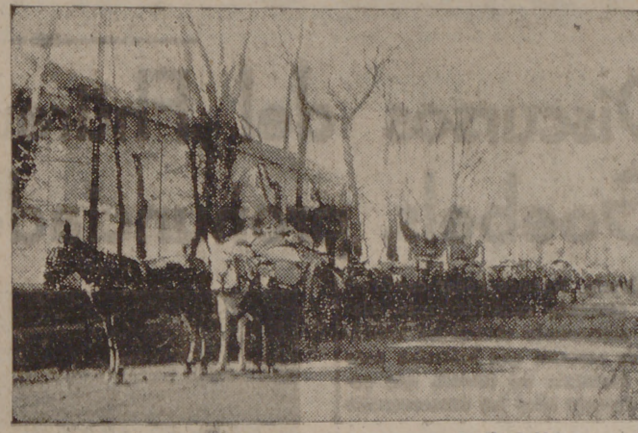
Entrega de trigo en las paneras de Valladolid

Tampoco es rara la presencia en estas plantaciones de una «ceniza» similar a la del viñedo y que marchita las hojas de las plantas. Comprobados los menores síntomas de la enfermedad, deben aplicarse azufrados, sin dejar depósitos del mismo sobre las hojas y en las horas más frescas de la jornada.