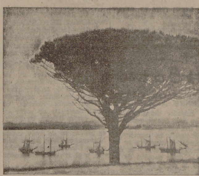
Veleros en el puerto de Santander