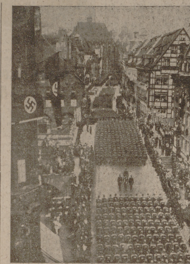
La S. A. desfila por las calles de Nuremberg

Estas nociones — comienza diciendo—son las que dominan hoy en la vida política de Europa. En el espíritu público son diametralmente opuestas, pero convie-