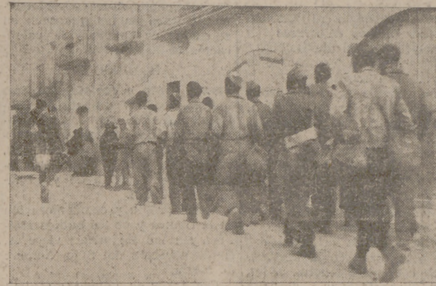
Prisioneros rojos internados en un pueblo aragonés