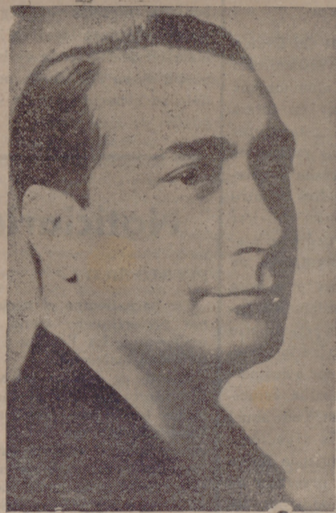
HEDILLA conductor de la falange en las horas difíciles.

nes y de la posible colocación de los productos.