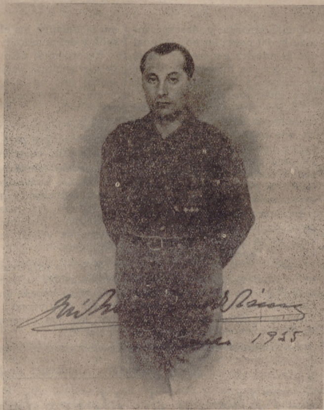
JOSE ANTONIO fundador de la Falange, definidor del estilo y teoría nacional-sindicalistas.

Todos los hombres recibirán una educación premilitar que les pre-