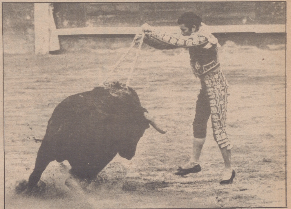
Paquirri ha estado apartado de los ruedos por enfermedad y ayer resultó herido de pronóstico leve