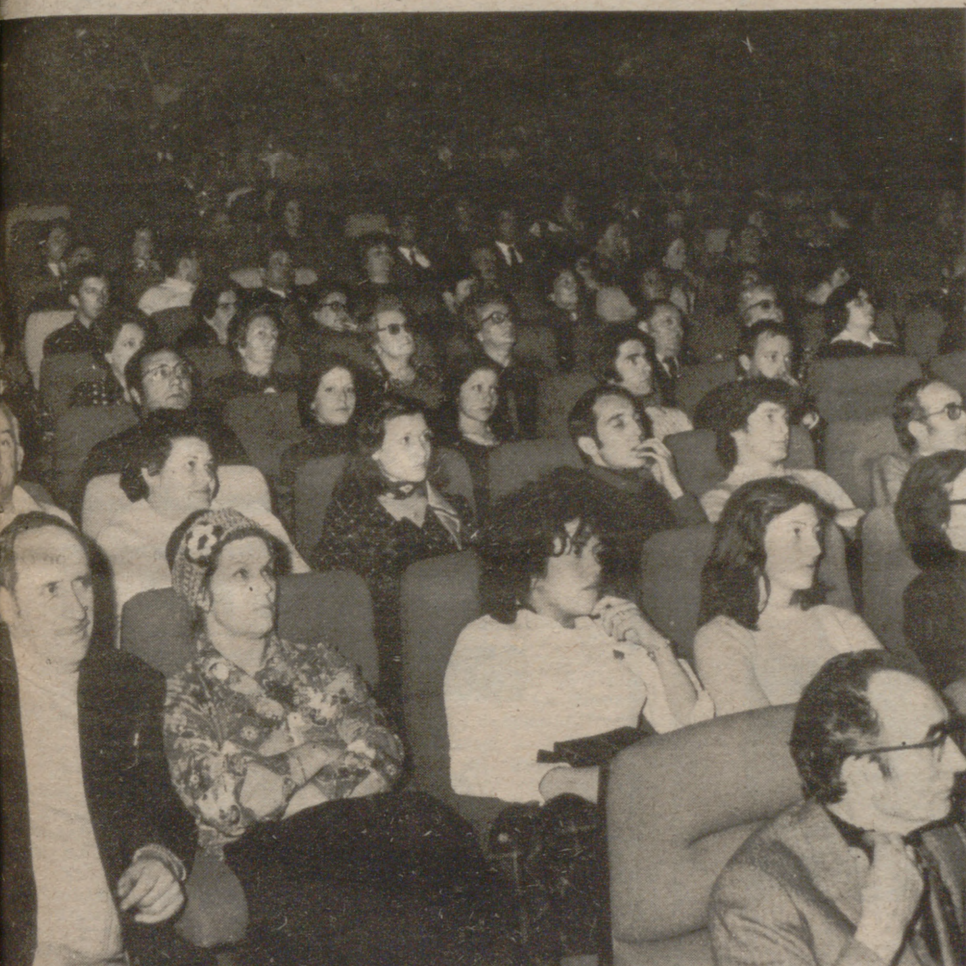
Los espectadores, comodamente sentados en las confortables butacas, siguen las incidencias de la película