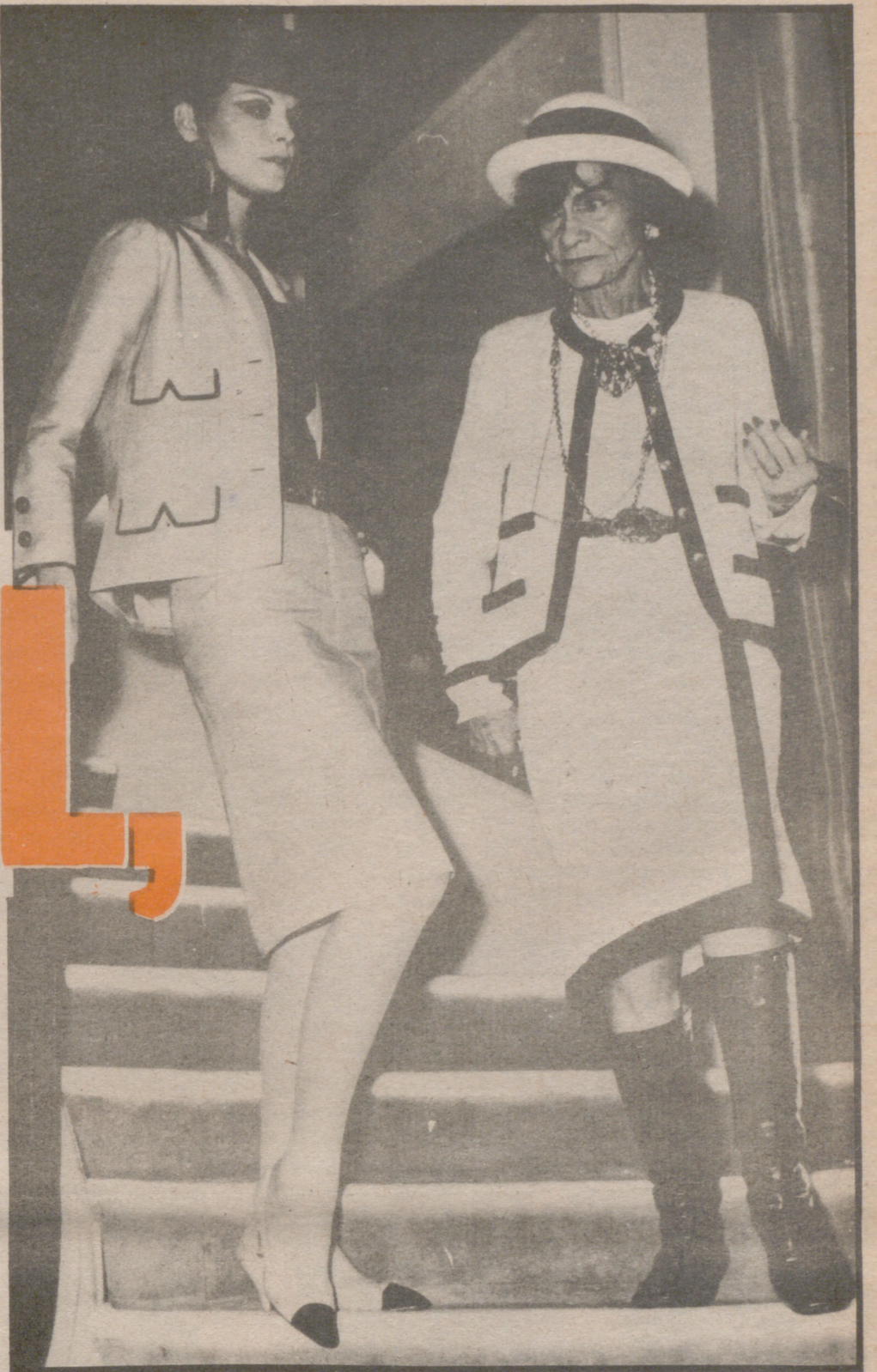
Gabrielle Chanel con la modelo española, una de sus preferidas, llamada Madina, luciendo un conjunto creado por la famosa diseñadora. — (Foto Efe).

Coco Chanelle desde que se hizo célebre, renunció a tener casa propia. "Las cosas propias —decía— dan muchos quebraderos de cabeza y yo ya tengo bastantes". Decidió vivir en un hotel, concretamente el hotel Ritz de París, donde moriría. Un pisito pequeño encima de su establecimiento, para recibir a los