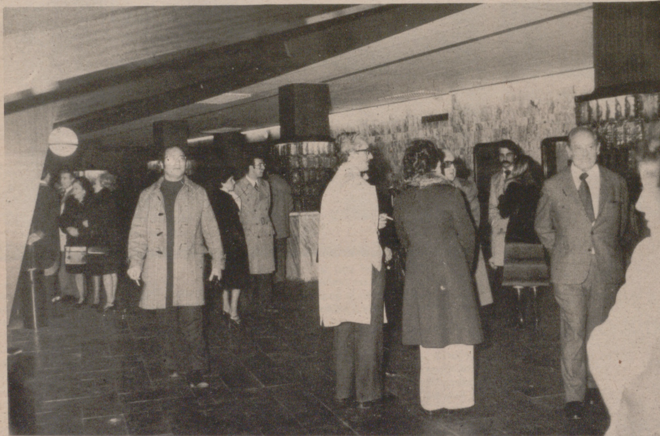
Un aspecto del vestíbulo en donde están los servicios de guardarropía y los de cafetería

espectáculos. Las paredes revestidas de mármol, en sus columnas destacan adornos artísticos de artesanía de cristal... al fondo a la derecha unas escaleras que, bajándolas, conducen a los servicios, amplios, dotados de una gran entrada dónde