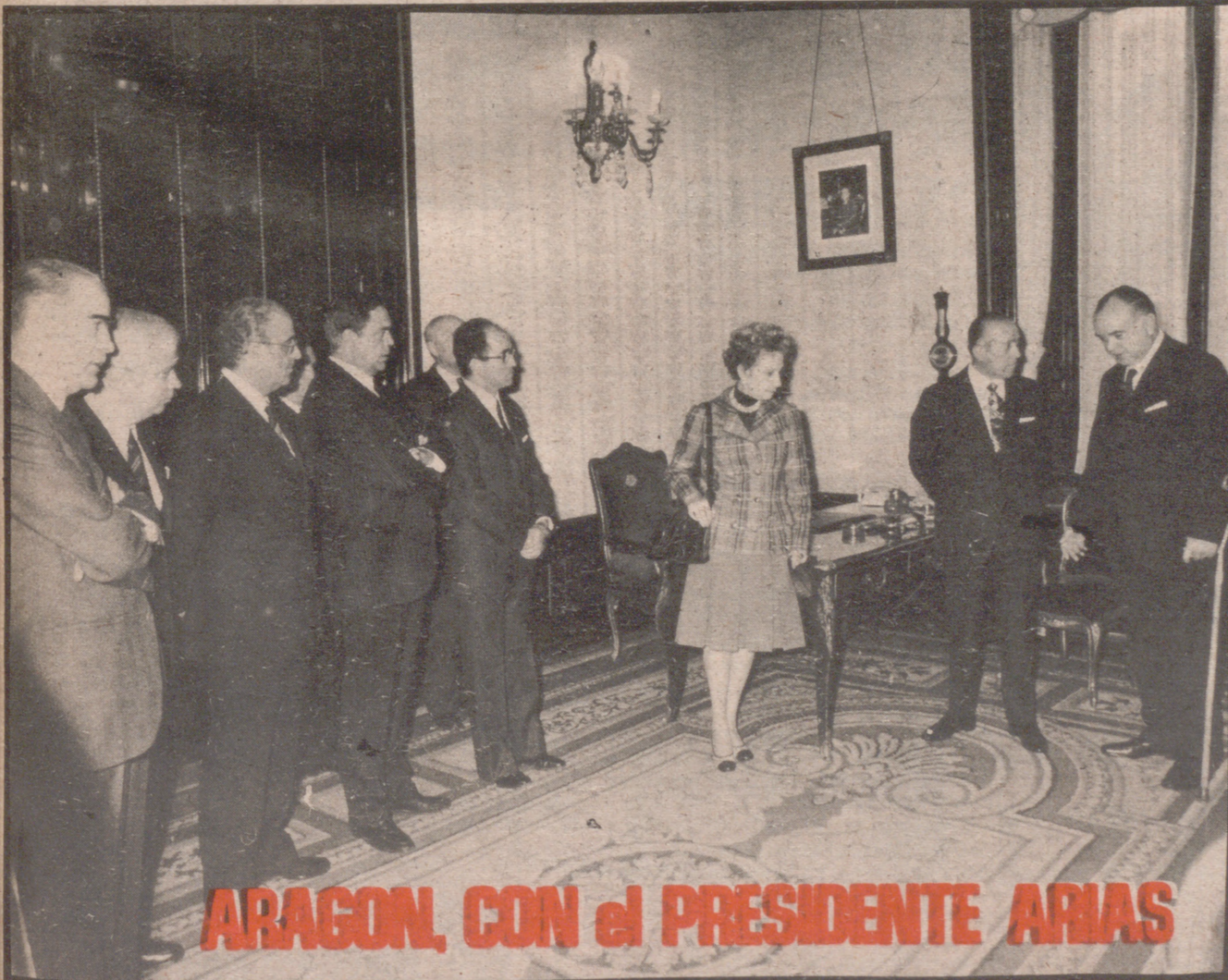
ARAGON, CON el PRESIDENTE ARIAS

E L diario "ABC" de Madrid publica hoy una encuesta con algunas figuras nacionales. En la encuesta, "ABC" pregunta cuáles han sido las consecuencias políticas de la desaparición del almirante Carrero Blanco. (Página 3)