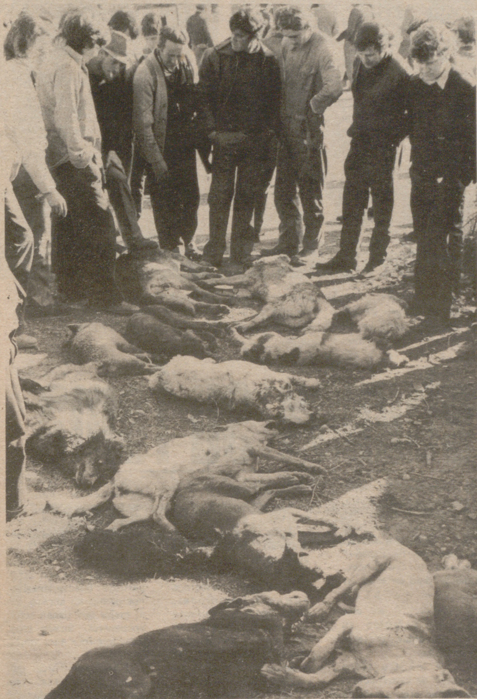
SORIA.- Quince perros salvajes y tres zorras fueron muertos en el curso de una cacería organizada por aficionados sorianos para exterminar a las fieras que últimamente han cobrado más de cuatrocientas víctimas entre las reses lanaras de esta provincia. La batida llevada a cabo por cuarenta aficionados, se efectuó en el monte conocido por Valonsadero. En la foto, los cazadores junto a algunas de las piezas cobradas.

SALVO LA VIDA DE UNA NIÑA QUE TODOS DABAN POR MUERTA