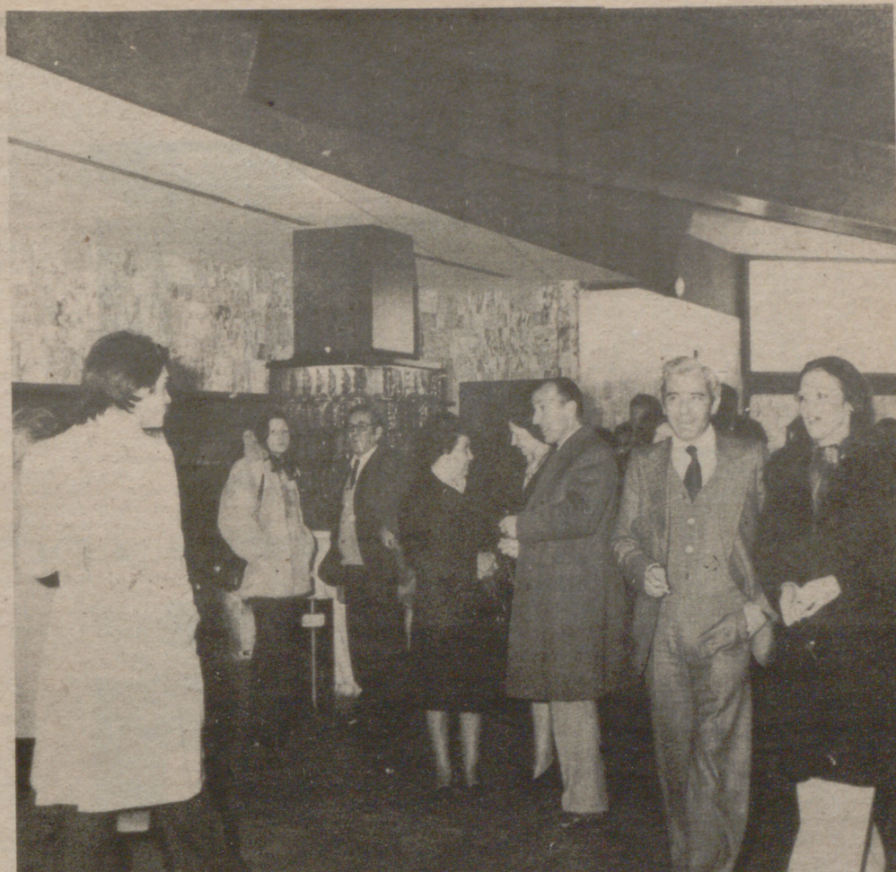
El público espera en el elegante, moderno y funcional vestíbulo, el comienzo de la película

La cabina de proyección del Cine Don Quijote está dotada de la técnica más depurada, y moderna con lo que el espectador logra, en la pantalla, una visión perfecta. Y es que la maquinaria de proyección, modernísima con una óptica especial para conseguir un máximo de enfoque.