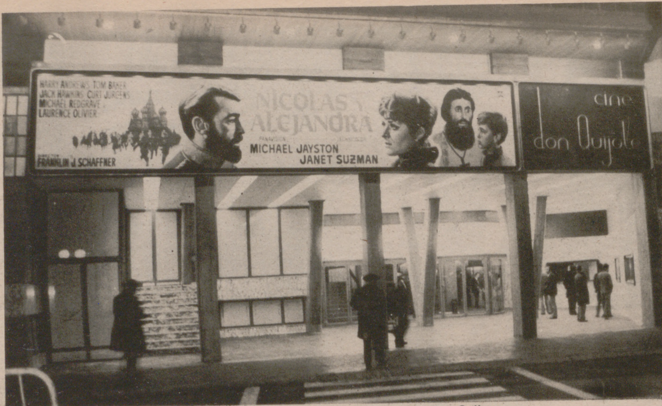
La moderna y amplia entrada del nuevo Cine Don Quijote.

E n una parte del solar de lo que fue antiguo cuartel del Carmen, se ha erigido un cine fastuoso, dotado de los medios y de las técnicas más modernas y actuales. La nueva sala cinematográfica propiedad de "Zaragoza Urbana, S.A.", —se llama Cine Don Quijote— tiene la entrada principal por la profanación de la calle Casa Jiménez, pues aunque tiene otra por la calle del General Sanjurjo, ésta sólo se ha previsto para salida de emergencia.