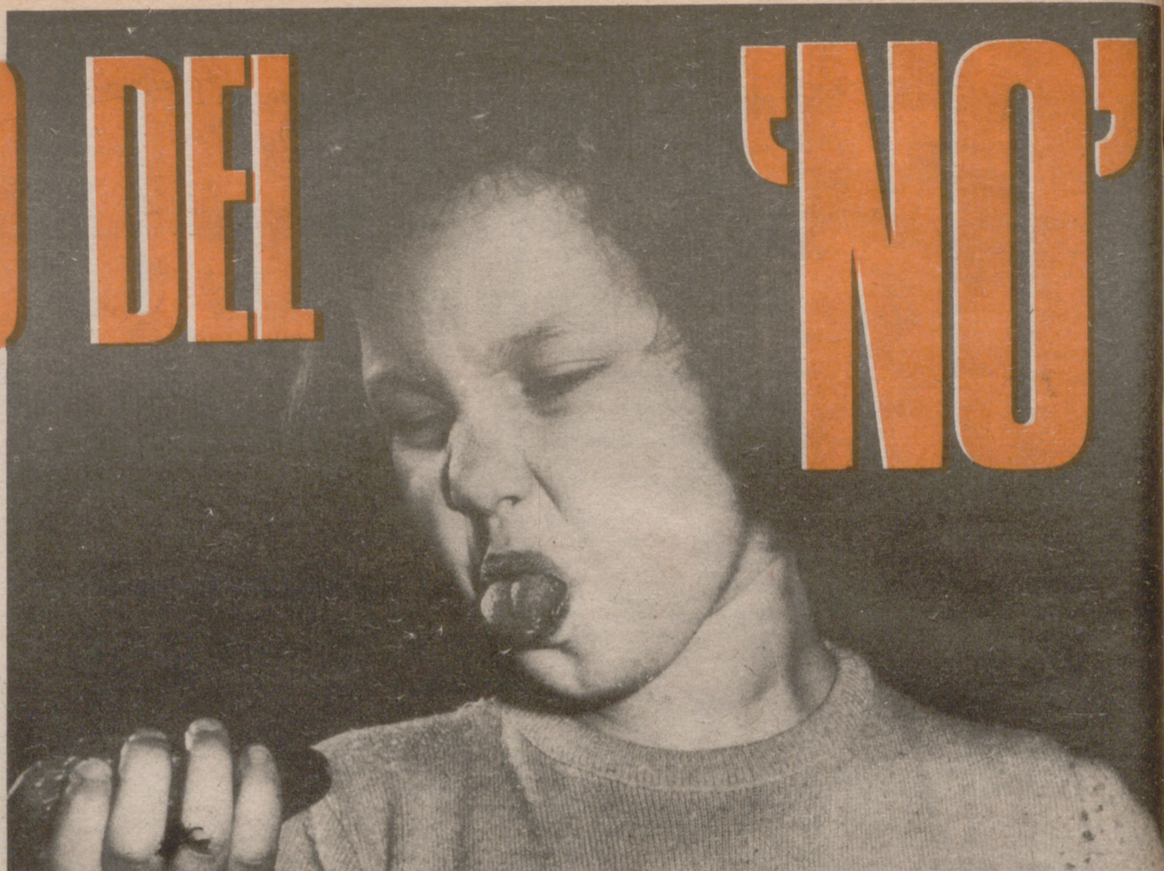
La firmeza absoluta en las prohibiciones justificadas cuando se trata por ejemplo de comer, provoca pequeños enfrentamientos, pero el niño protestatario debe sentirse ante una voluntad que responda a la suya.

Frente a estas manifestaciones de desequilibrio, ¿cuál es o cuál será su comportamiento? ¿Siente usted la necesidad de modificarlo? ¿Presiente usted las consecuencias de una educación mal adaptada?