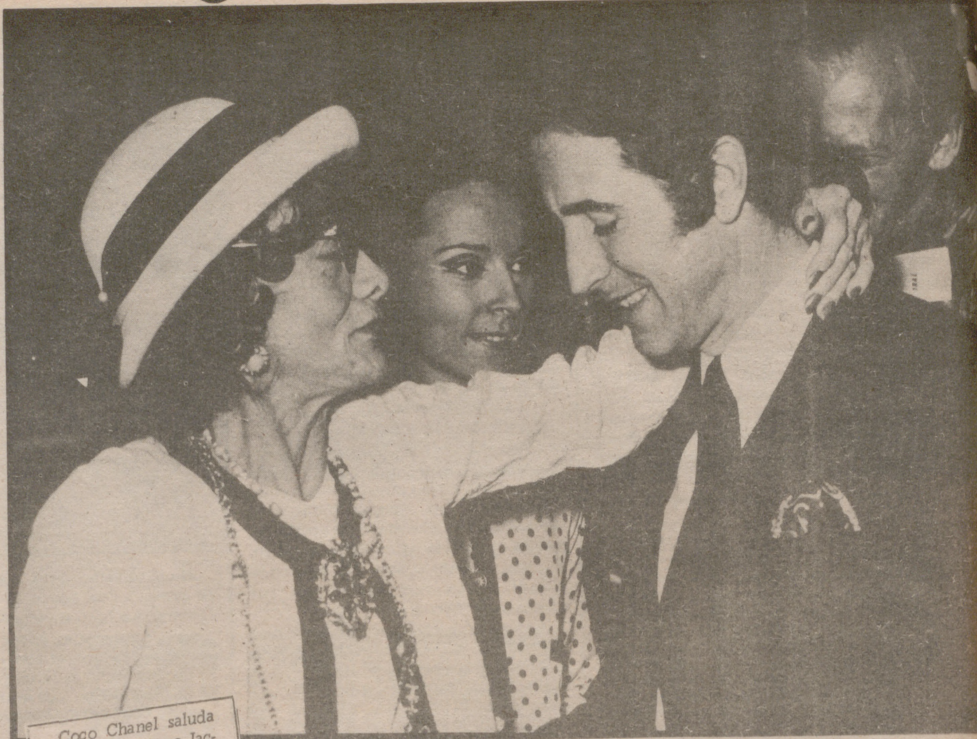
Coco Chanel saluda cariñosamente a Jacques Chazot, famoso artista también.

los de otros modistos, como Christian Dior— una fábrica de tejidos y empleadas a 2.400 personas. Fue la primera persona que concibió la idea de aunar perfume y moda. Creo, con la ayuda del químico