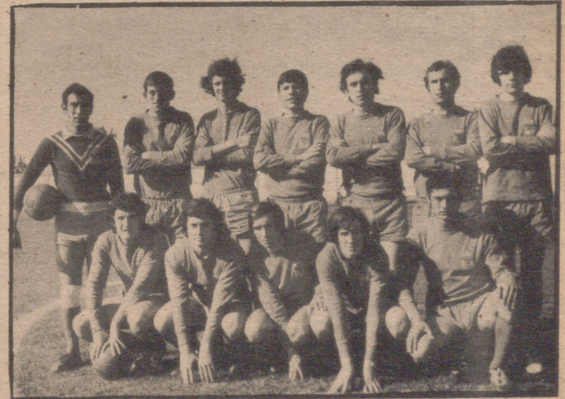
EL CARIÑENA SE IMPUSO AL ARENAS EN "ENTRE RIOS"