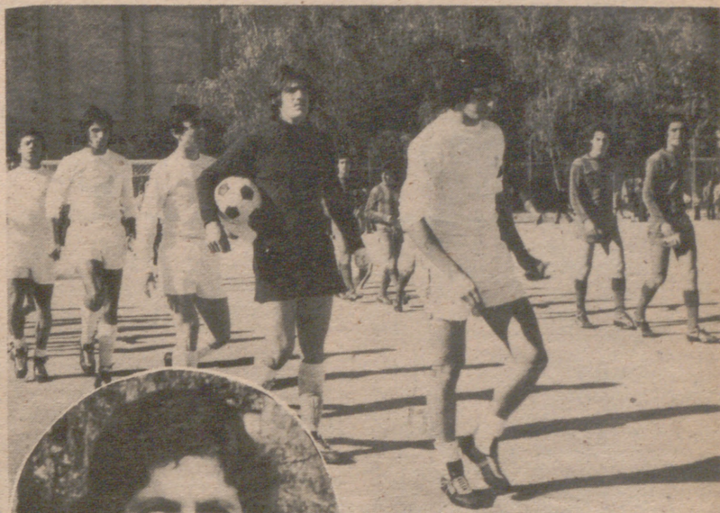
PASTOR SALIDA DE LOS EQUIPOS