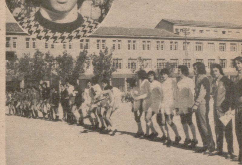
SALUDANDO EN EL CIRCULO CENTRAL