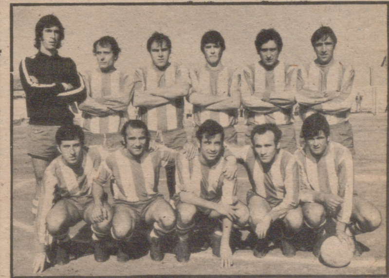
EJEA, QUE VENCIO EN "LA CAMISERA" AL OLIVER