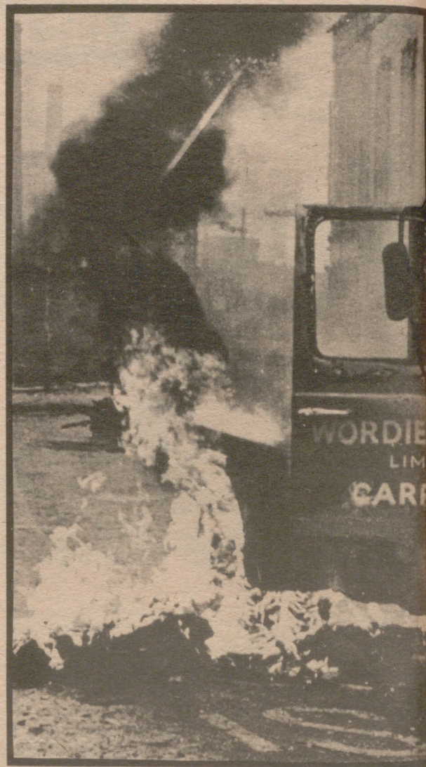
BELFAST.—Un camión en llamas bloquea parte de la carretera en Belfast, durante las manifestaciones de protesta celebradas en apoyo de los prisioneros de la cárcel de Maze.

/// FUEGO EN SOLIDARIDAD CON LOS INCENDIARIOS