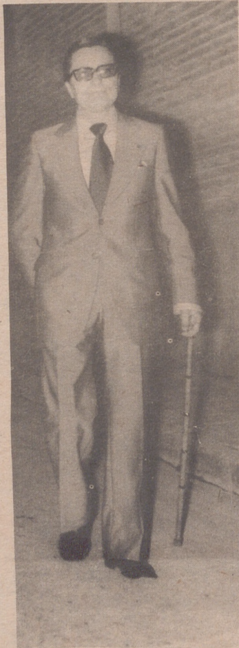
las Fiestas merece siempre los más encendidos elogios, pero, si cabe, en esta ocasión han sido superados todos los comentarios

de admiración. ¿A quién se debe y cómo surgen los motivos de estos murales?