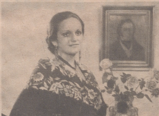
REINA DE LAS FIESTAS

A las diez de la noche, clausura de la XI FERIA DE MAQUINARIA. Este día por la Intervención municipal de fondos, se distribuirá a domicilio a los inscritos en el Padrón de Beneficencia, un donativo por familia, haciéndose lo mismo con las Conferencias de San Vicente de Paúl.