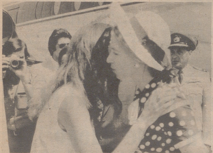
SEVILLA. La princesa Ana de Inglaterra al descender del avión en el aeropuerto de San Pablo de Sevilla. (Foto: Europa Press).