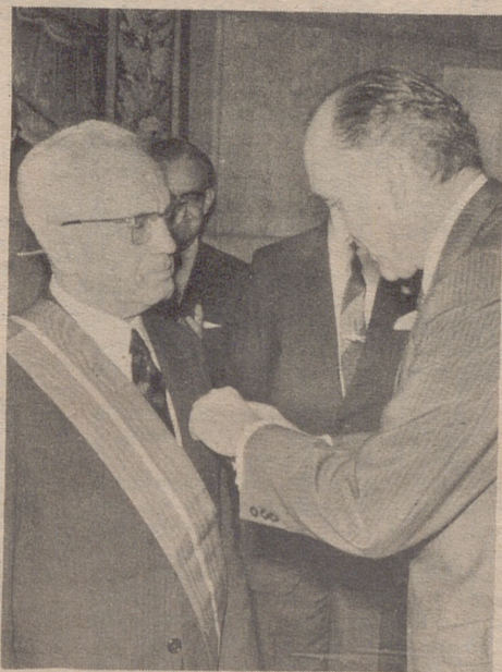
MADRID. Don Licinio de la Fuente ministro de Trabajo impuso la Gran Cruz del Mérito Civil a don Vicente Cañada Blanch, después de la donación que hizo este al Instituto Nacional de Emigración, de 50 millones de pesetas.