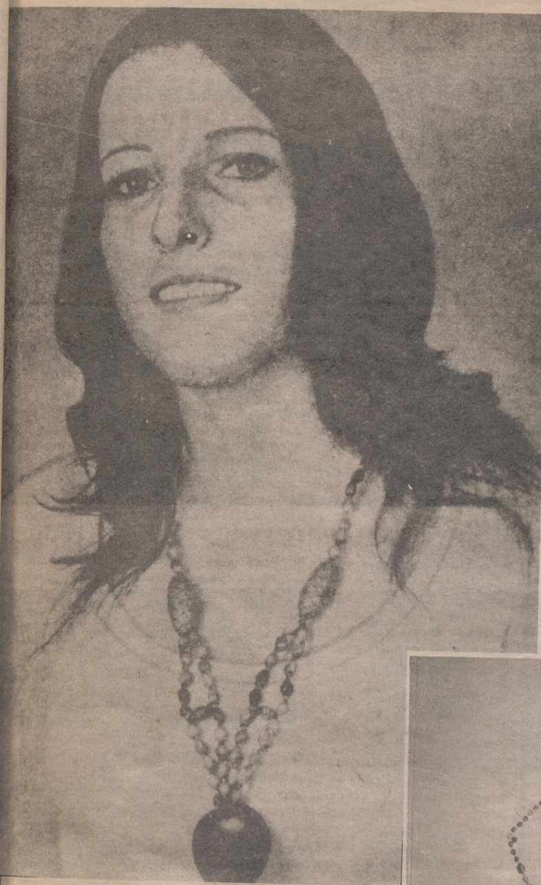
Arriba, un auténtico "collar de la muerte", encontrado en Inglaterra. A la derecha, el primer collar entregado como sospechoso en la Jefatura de Sanidad de Zaragoza. Fue comprado hace un año en Canarias