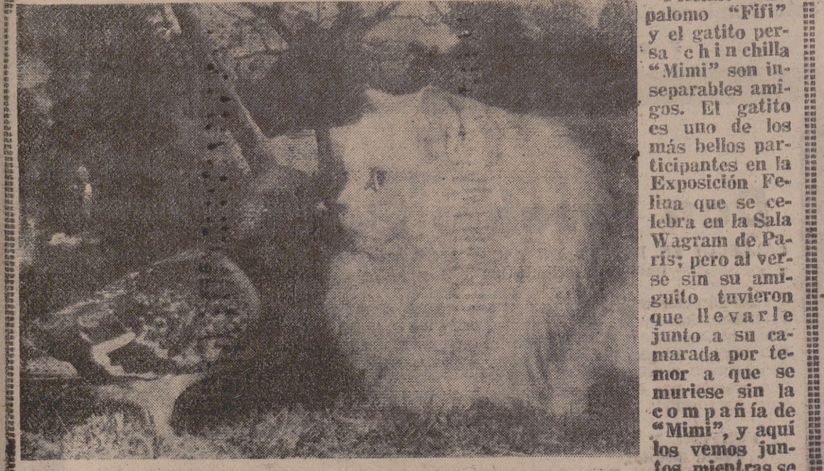
celebra la exhibición gatuna. Los animales siguen dándonos ejemplos bellos de coexistencia pacífica. De esa paz que tanta falta hace a nuestro mundo. Gracias, "Fifi" y "Mimi". — (Foto Torreamecha).