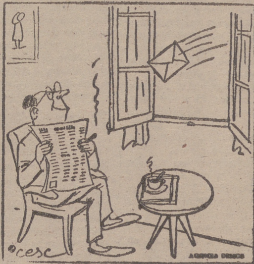
SECCIONES DE PRESTIDIGITACION POR CORRUPCION