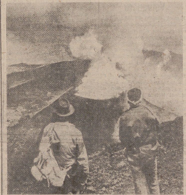
CATANIA (Sicilia).—Una vista de la nueva boca del volcán Etna, en erupción. Cada siete minutos deja oír una explosión, acompañada de fuego, lava y piedras ardentés.