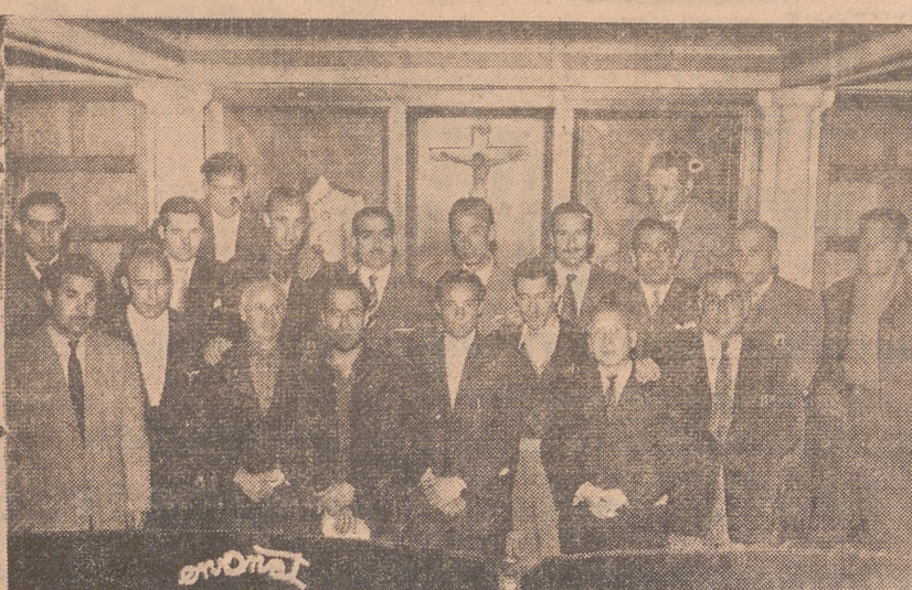
GRUPO DE TRABAJADORES Y JERARQUIAS SINDICALES QUE ASISTIERON AL CONGRESO REGIONAL DE ZARAGOZA EN REPRESENTACION DE NUESTRA PROVINCIA.

Terminada nuestra conversación con el señor Castillo, tuvimos el gusto de charlar con los trabajadores riojanos que han participado en el Congreso, recogiendo sus satisfactorias impresiones acerca del desarrollo y resultado del mismo. De estas impresiones, trasladamos a nuestros lectores las de dos de los