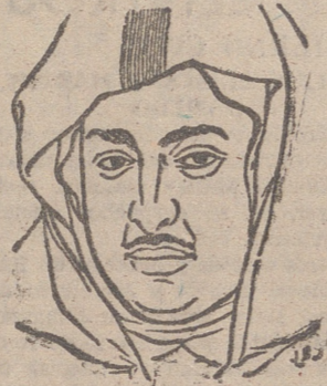
S. A. I. EL JALIFA

Los representantes de los dos pueblos asistieron al banquete con que las autoridades musulmanas conmemoraban el grandioso homenaje de adhesión que Marruecos rindió a España el pasado año