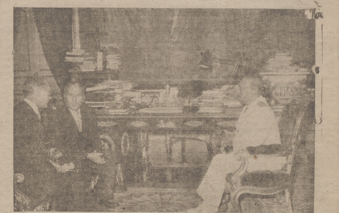
MADRID. — S. E. el jefe del Estado durante la audiencia concedida al ex primer ministro del Líbano S. E. Abdullah El Yafi.