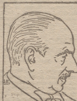
DON JOSÉ MARÍA PEMÁN