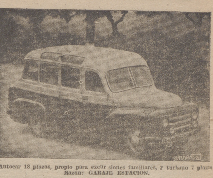
Autocar 18 plazas, propio para excursiones familiares, y turismo 7 plazas. Razón: GARAJE ESTACION.

Un espectáculo fastuoso e inolvidable, con la fascinante «DANZA DE LOS SIETE VELOS», que embrujó a un rey y cambió el curso de la Historia. EL VIBRANTE RELATO DE UNO DE LOS HECHOS MAS HISTORICIALES DE LA HISTORIA EN LAS PASATUOSA Y SORPRENDENTE SUPERPRODUCCION JAMAS LLEVADA A LA PANTALLA. UN FASCINANTE ESPECTACULO QUE ADMIRARA TODO LOGROÑO Y SU PROVINCIA.