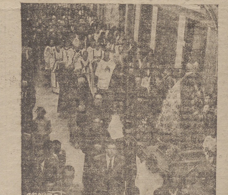
Un momento de la solemne misa celebrada en el Monasterio de Santa María la Real, y otro de la procesión celebrada a continuación por las tres najerinas.