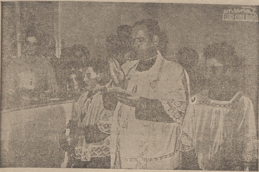
Momento de la bendición del despacho de pan de la nueva «Panificadora Eléctrica Segura», inaugurada anteayer.

Por primera vez ha sido instalado en nuestra capital un horno eléctrico-giratorio para panadería, cuyo sistema viene a revolucionar el procedimiento de cocción del pan