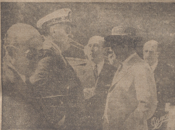
LOS SEÑORES GONZÁLEZ GALLARZA Y CONDE DE VALLELLANO CAMBIANDO IMPRESIONES CON EL INGENIERO DIRECTOR DE LAS OBRAS DEL PANTANO DE MANSILLA

landarte y banda de clarines, que les rindieron honores, y seguidamente tuvieron en el mismo palacio de la Diputación un detenido cambio de impresiones sobre los distintos e importantes problemas y mejoras proyectadas para Logroño y su provincia, motivo del visite de los ilustres visitantes a nuestra capital.