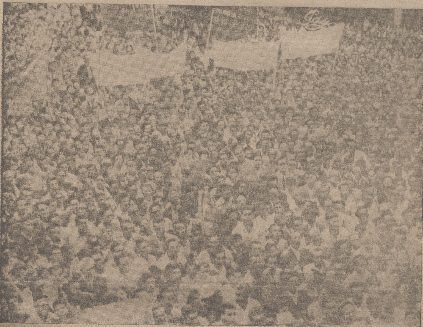
IMPONENTE ASPECTO QUE OFRECIA LA PLAZA DEL AYUNTAMIENTO DE NAJERA EN LA VISITA DE LOS MINISTROS DEL AIRE Y DE OBRAS PÚBLICAS A DICHA CIUDAD.

Ambos ministros pasaron revista a las fuerzas de Artillería, con es-