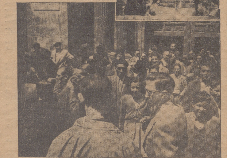
La imagen de San Honorato, ante la que se cantó la primera misa, saliendo de la Iglesia de Palacio

Antes de la misa fué bendecida la imagen de San Honorato, ante la que se cantó la primera misa, saliendo de la Iglesia de Palacio.