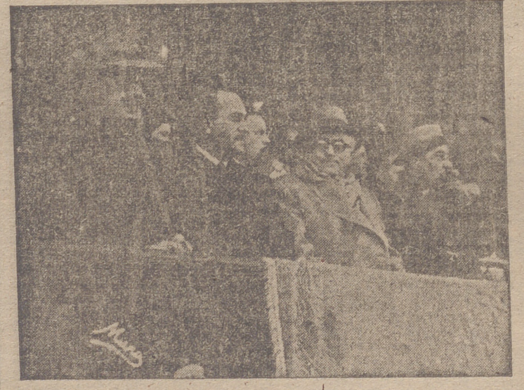
El capitán general de la Región, general Yagüe, preside, en unión de las demás autoridades burgalesas, el partido.

verdaderamente magnífico. Entre los capitanes de ambos equipos se cambian los saludos de rigor, ofreciendo el del Logroñés un precioso ramo de claveles rojo que presiden el partido.