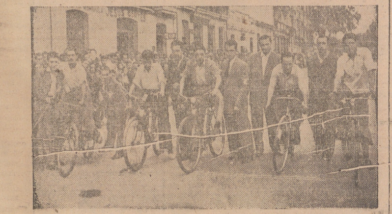
El vencedor de la prueba y momento de la salida.