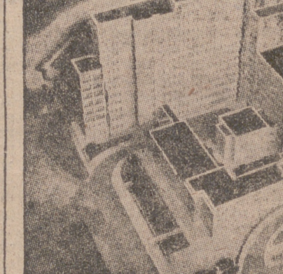
Maqueta de la Residencia Sanitaria que la Caja Nacional del Seguro de Enfermedad está construyendo en Zaragoza.