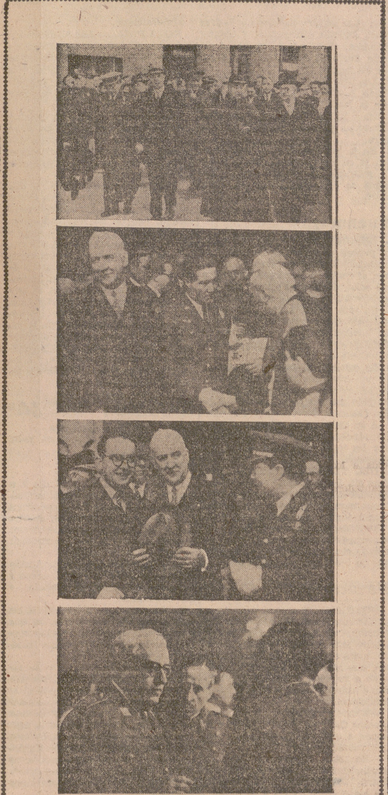
1.ª, 2.ª y 3.ª Los ministros y autoridades en tres momentos de la salida de la Colegiata de Santa María de la Redonda, donde se celebró solemnemente un Te Deum en homenaje al Santo Padre. 4.ª El teniente general Yagüe, a su llegada a Logroño, es cumplimentado por los mandos militares de la plaza.