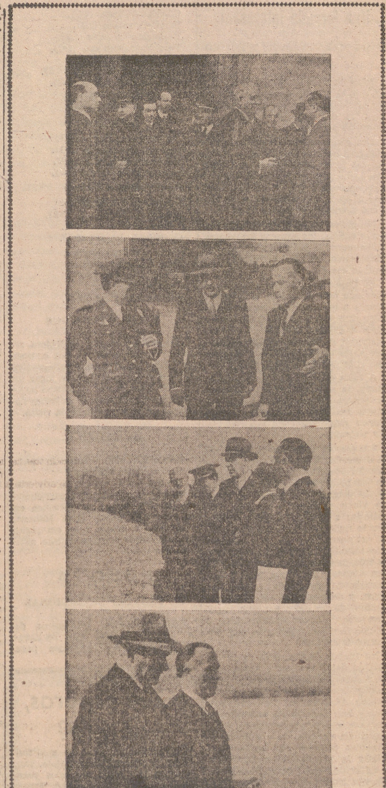
1.ª Los ministros y autoridades al salir de la catedral de Calahorra. 2.ª, 3.ª y 4.ª Los ilustres visitantes contemplan los daños ocasionados por las aguas del Ebro en las huertas ribereñas y las obras de defensa que se realizan en la desembocadura del Cidacos.