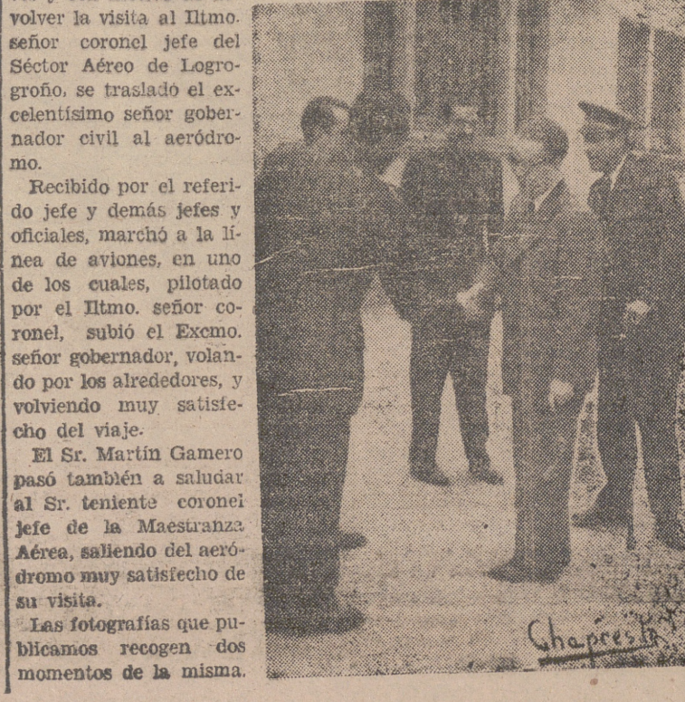
Las fotografías que publicamos recogen dos momentos de la misma.