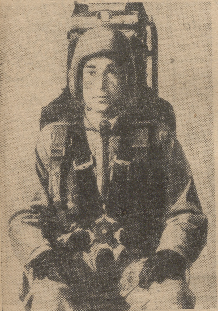
André Allemand, el primer paracaidista del mundo que fué lanzado a 800 kilómetros por hora en asiento catapultable.

UNA noticia de Washington informaba la semana pasada que dos oficiales de las Fuerzas Aéreas norteamericanas han establecido un nuevo récord de lanzamiento en paracaídas al tirarse—ser tirados, más exactamente—desde una altura superior a los doce kilómetros en saltos de pruebas desde un bombardero de reacción "B-47".