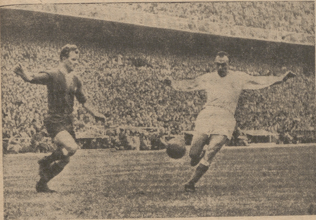
Kubala trata de arebatar el balón a Di Stéfano. Dos delanteros centro frente a frente. Dos jugadores excepcionales. Dos "fenómenos"...