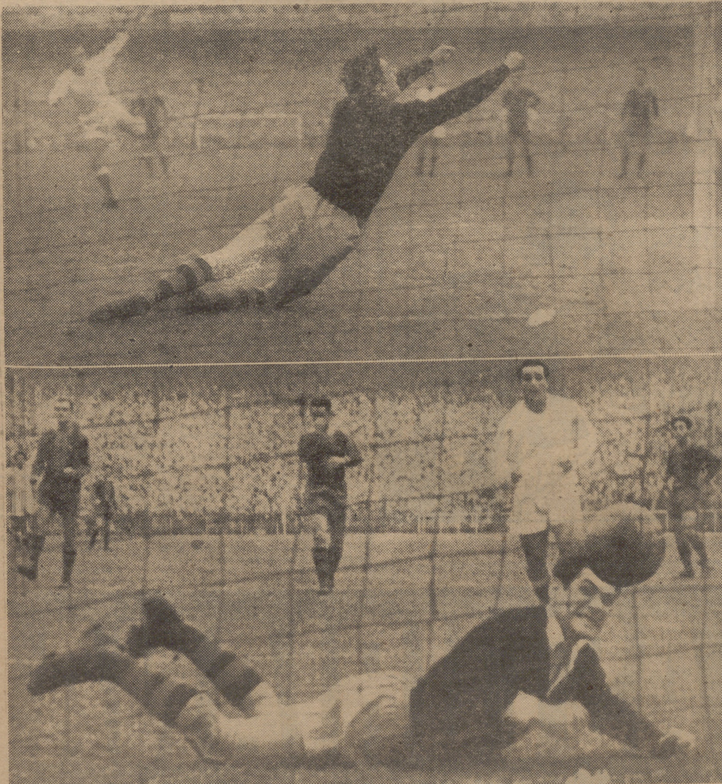
He aquí dos tiempos del penalty transformado por Di Stéfano en el primer gol madridista