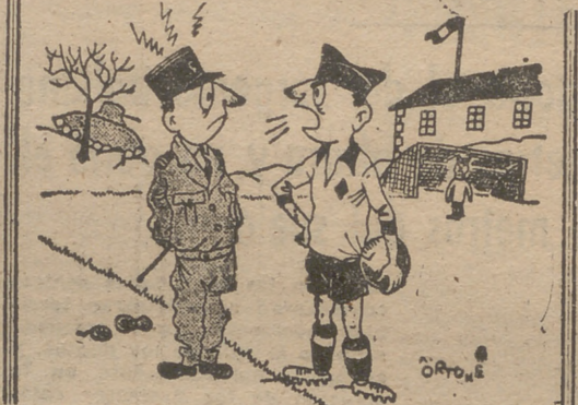
—¡Teniente, saludeme usted, que soy el capitán del equipo!