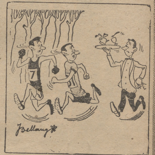
—¿El té, para quién es?