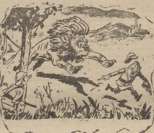
—¡Allí, allí está él!