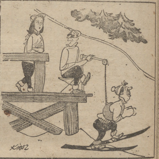
—Y durante el reciente verano he sido profesor de natación...