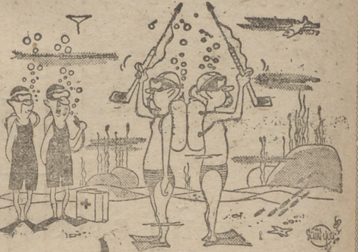
—Señores, ¿están ustedes preparados?