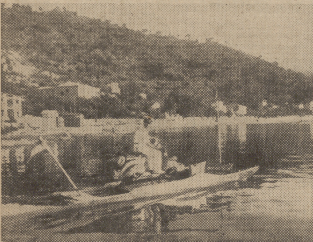
Otro momento de la travesía, rumbo a Barcelona