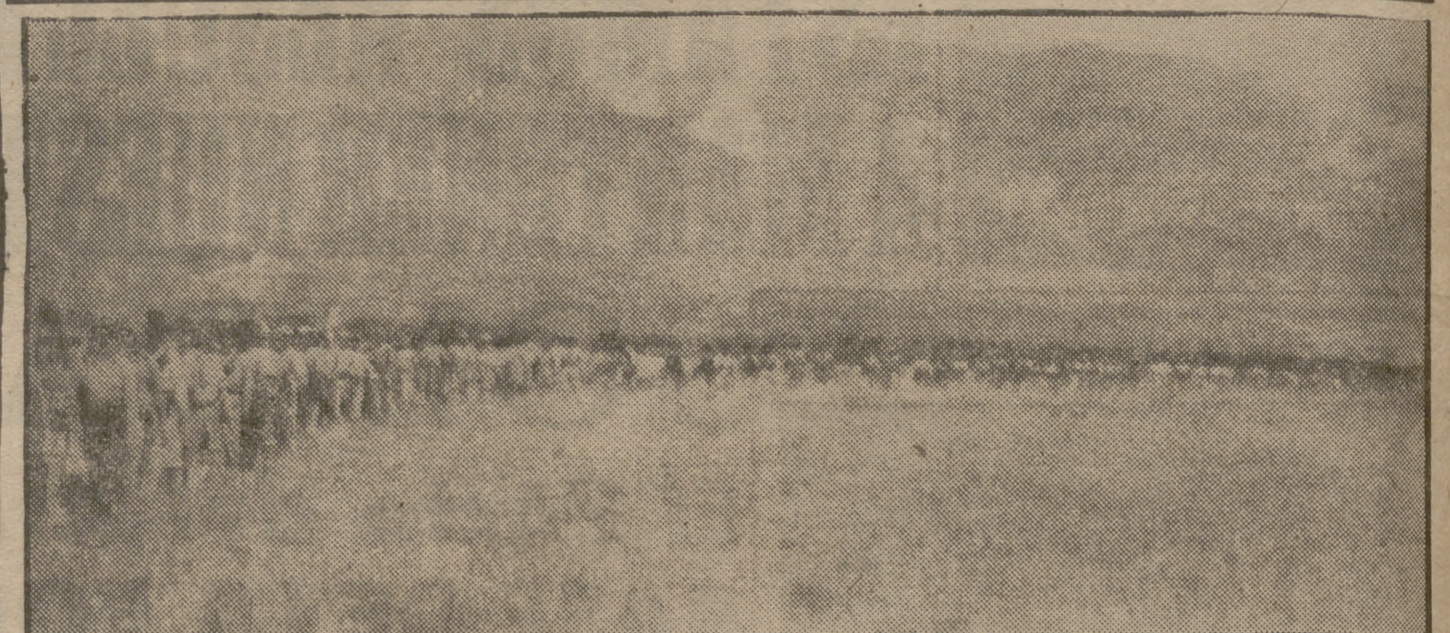
Los guerrilleros avanzan por los llanos para enfrentarse con las tropas gubernamentales.