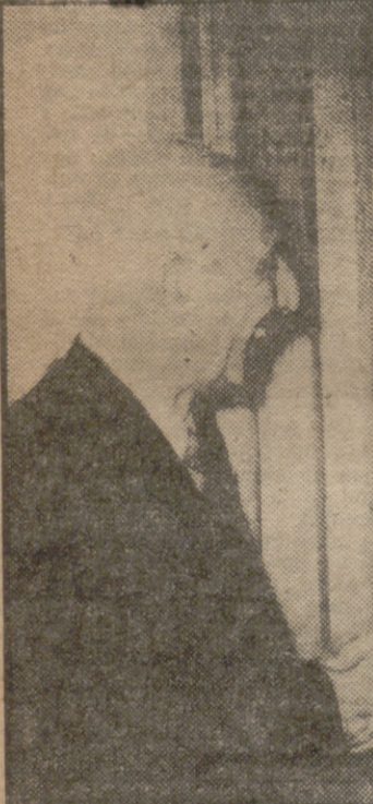
Mussadeq, en una de sus incógnitas posturas. El jefe religioso, Kashani, parece que se propone continuar la política del primer ministro depuesto.

EL CAIRO. (Crónica del corresponsal de FIEL, A. Ch.) M IENTRAS Mussadeq prosigue con sus declaraciones desconcertantes ante el Tribunal que le juzga, mientras las agencias internacionales y los periodistas sensacionalistas tratan de destrozarlo todo el prestigio de un político iraní, en el silencio de los grandes acontecimientos se está gestando una nueva revolución en Teherán. Esto es al menos lo que afirman los bien enterados en las conversaciones al oído por todo el Oriente Medio.