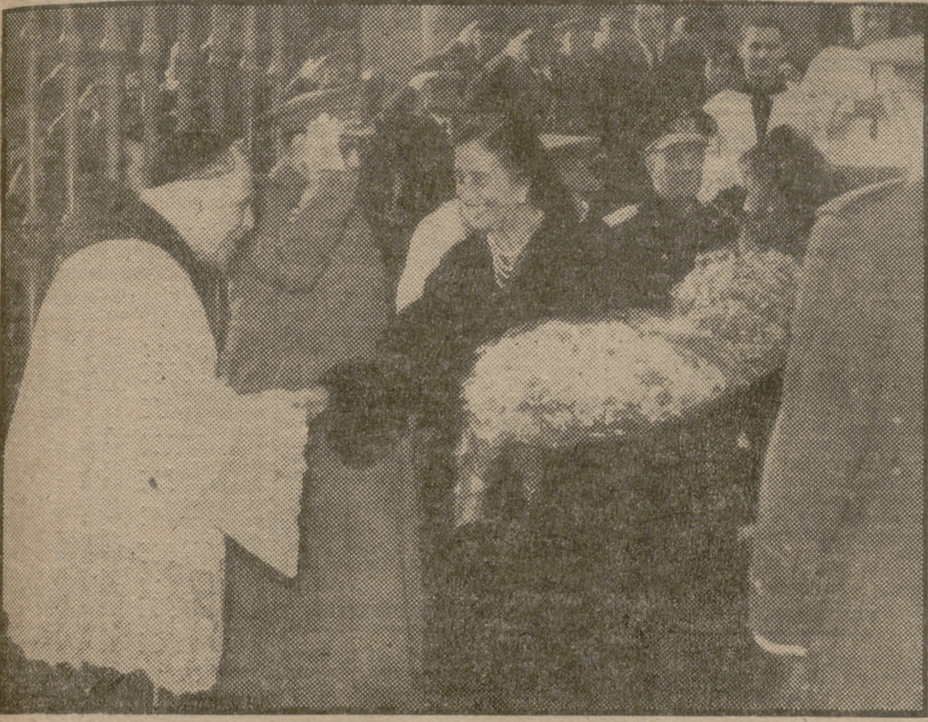
La excelentísima señora doña Carmen Polo de Franco, a la salida del templo de San Francisco el Grande, donde el Arma de Infantería celebró una solemne ceremonia religiosa en honor de su Patrona, la Inmaculada Concepción.