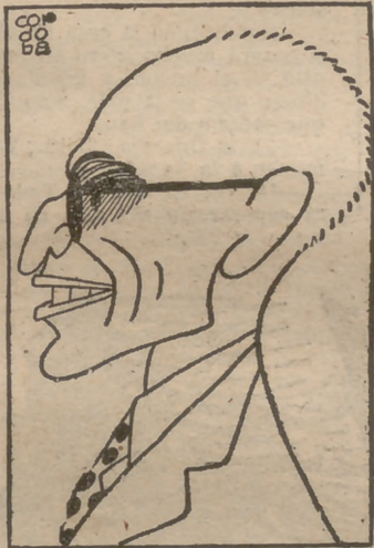
Y en otros factores que son múltiples.