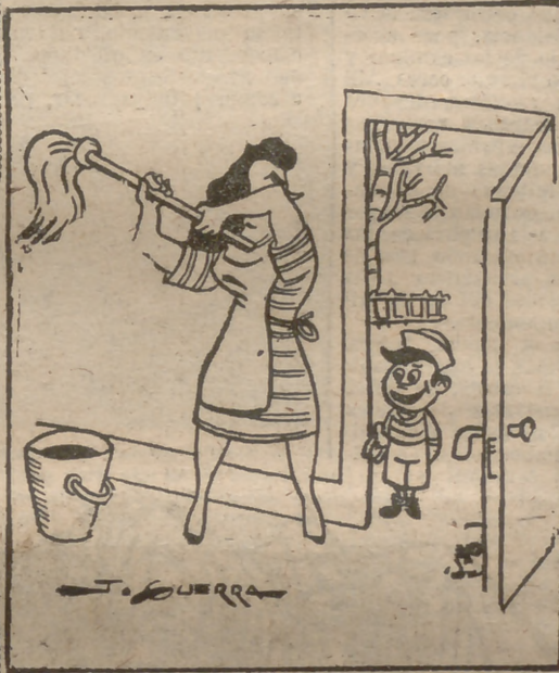
—¿Estás esperando a papá?