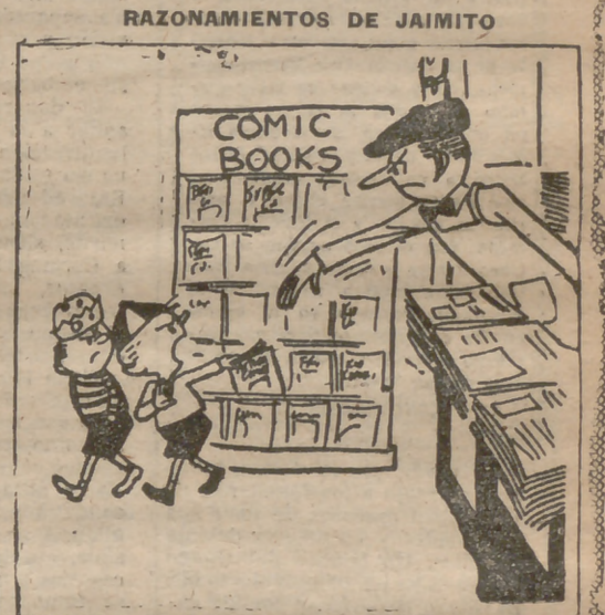
—¿Y la libertad de prensa, qué?