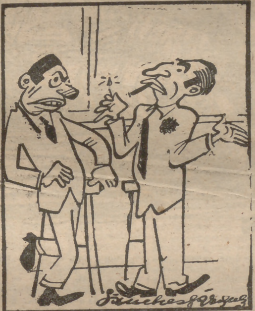
—¿Cómo salieron los toros? —Como siempre! Uno detrás de otro. ¿O es que los iban a echá toos juntos?