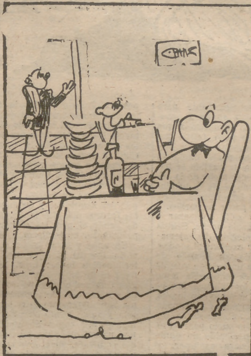
—¿Camarero! ¿La cuenta y un guardia!..