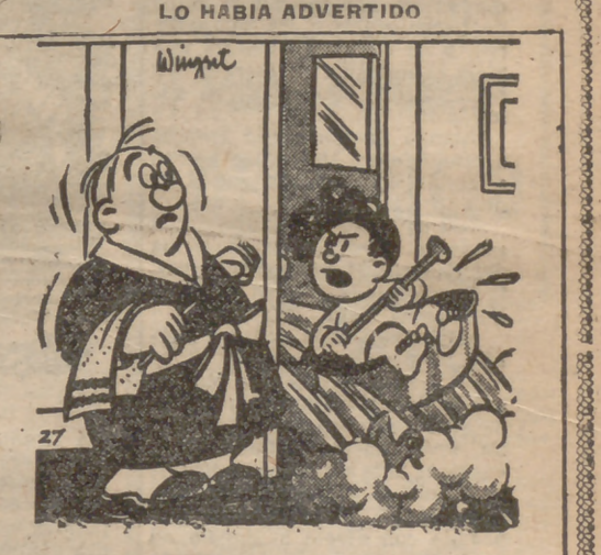
—Ya te había dicho que no abrieras la puerta que los iban a echá toos juntos?