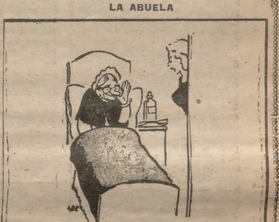
—¿Te ha reconocido bien el médico, abuelita? —¡Ah! ¿Era el médico? Ya decía yo que sus ademanes eran demasiado familiares para ser una visita de cumplido...