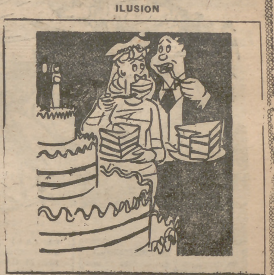
—Querido, dime que todos nuestros días serán como hoy.