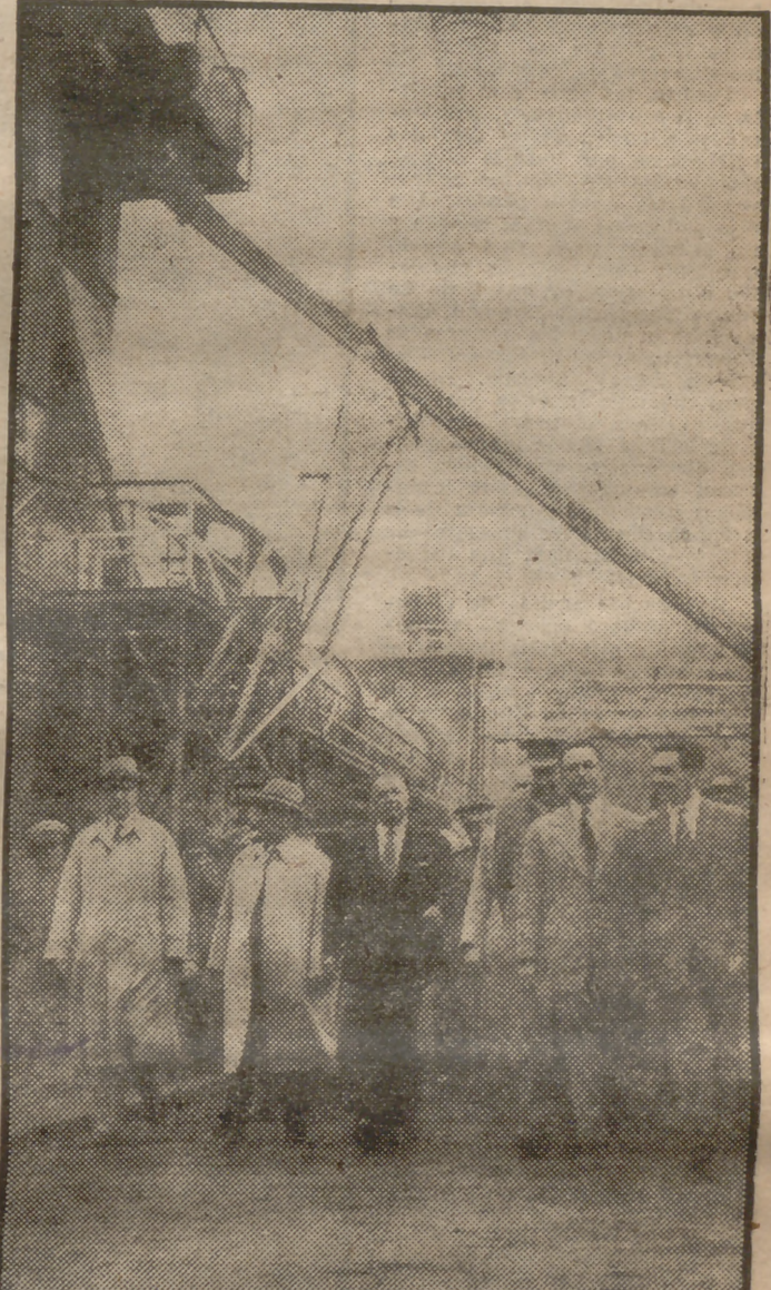
El Caudillo visitó en Xeralló las instalaciones de la magnífica fábrica de cementos de aquella localidad, una muestra más de la potencia industrial que España va alcanzando en su segura batalla de la paz.