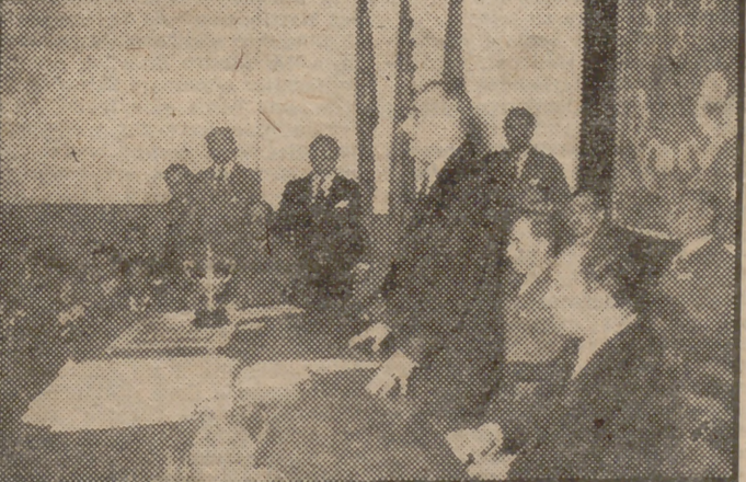
Nuestras fotografías recogen tres momentos de la solemne clausura de la Feria Internacional del Campo. Arriba, desfile de las reinas y sus séquitos, ataviadas con trajes regionales. Centro, el Delegado Nacional de Sindicatos, señor Solís, hace entrega de los trofeos a los ganadores del I Premio de Motocicletas de la Feria Internacional del Campo. Abajo, el ministro de Agricultura pronuncia el discurso de clausura.