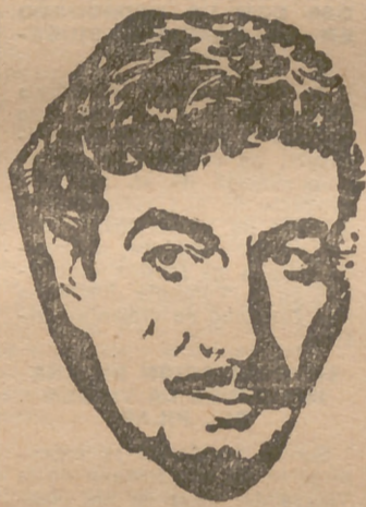
Robert Taylor en su magnífica caracterización en ‘Ivanhoe’

No fué hasta noviembre de 1951 que Taylor pudo realizar su ideal de empuñar la escopeta para dirigirse a Oregón. Por aquella fecha había terminado su labor en la colosal ‘Quo Vadis?’, filmada en Roma durante 1950; en ‘Westward the Women’, una producción de Dore Schary sobre los primeros pobladores del Oeste americano, e ‘Ivanhoe’, la película americana más importante de