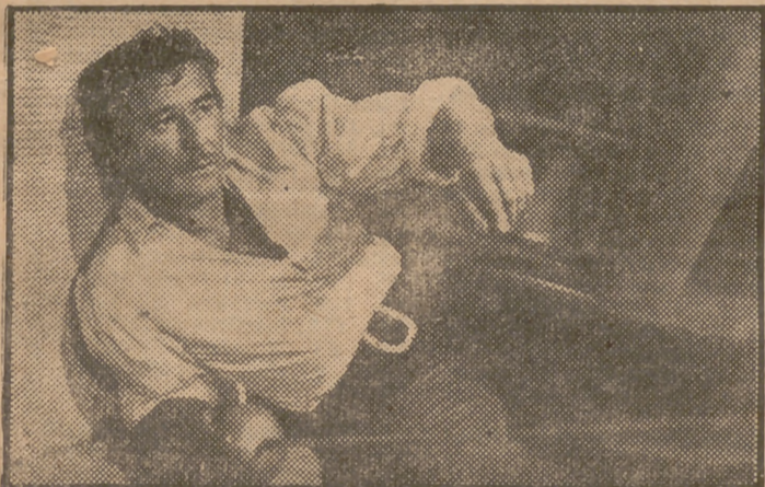
He aquí a Errol Flynn en un primer plano del espectacular film ‘La isla de los corsarios’, la más fantástica de las superproducciones, en un bellissimo tecnicolor. Una obra maestra de la cinematografía que muy pronto se estrenará en Madrid, presentada por la Universal Internacional