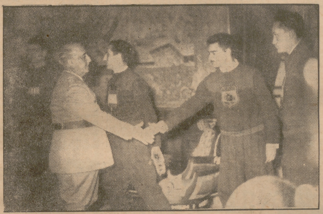
Esta mañana, en el Palacio del Pardo, el Caudillo de España y Jefe Nacional del Movimiento hizo entrega a una escuadra motorizada de universitarios madrileños de un mensaje dirigido a los IV Juegos Universitarios Nacionales, que se celebrarán dentro de unos días en Barcelona, con la colaboración de más de 88 equipos y 11 selecciones de atletismo, y en los que participarán 2.100 estudiantes, que contendrán en doce deportes distintos.