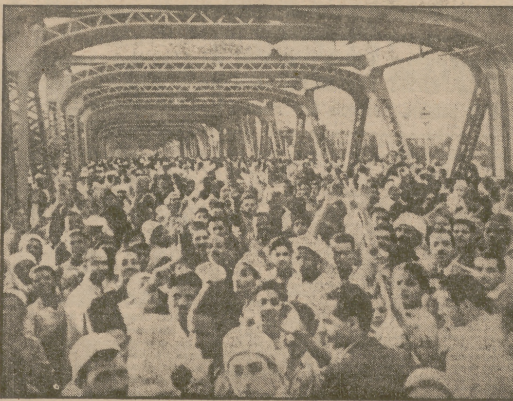
Una demostración indígena cruza el puente de Boulac, en El Cairo, con el intento de dirigirse a Zamalek, suburbio en una isla en el Nilo, donde habita una gran parte de la colonia extranjera en la capital de Egipto. La Policía disolvió la manifestación.