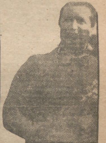
El italiano Ascari calla y toma hasta el momento de tomar la salida en Pedralbes. Entonces "responderá" a Fangio. ¿Cuál de los dos "apretará" más? ¿A cuál de los dos recibirá primera la bandera a cuadros?

Han llegado para asistir a la gran carrera Peña Rhin los famosos corredores alemanes Lang y Garacicola, con el director deportivo de Mercedes-Benz, señor Neubauer.