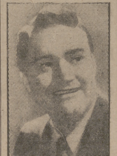
carrera. Cayó de bruces por primera vez a la edad de diez años, cómicos que anunciaban medicando cuando viajaba ayudando a unos

Skelton se ha caído más de 15.000 veces en su asombrosa