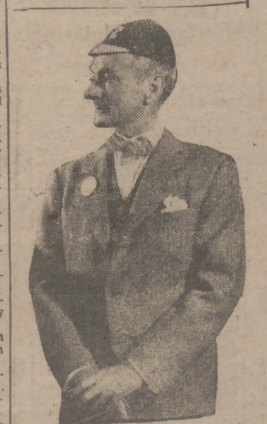
Clifton Webb, el formidable actor, protagonista del film de gran éxito "Niñera moderna", logra la más jocosos de sus interpretaciones en la divertidísima película "¿Se puede entrar?". que próximamente se estrenará en el aristocrático cine Rex.

A pesar de lo real que hace aparecer su caracterización cómica de borracho, una de sus especialidades, Skelton nunca injiere bebidas alcohólicas. Tampoco fuma, aunque tiene la costumbre de llevar un cigarrero en la boca (sin encender, claro).