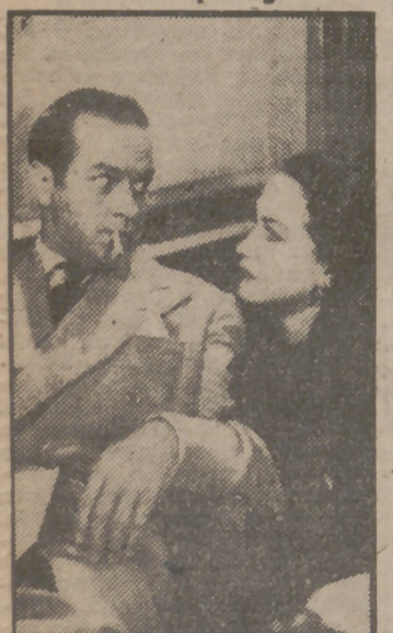
La bellísima Dorothy Lamour y el graciosísimo actor Bob Hope en una escena de "Morena y peligrosa", el mayor éxito de risa del cine estadounidense, la más graciosa y original interpretación del mago de la comedia, Bob Hope. Para en breve se anuncia el estreno en Madrid de esta jocososa película, que nos presentará Cifesa.