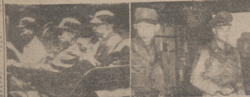
He aquí dos casi famosas fotografías de sendas escenas de las conversaciones de Kaesong, suspendidas por los comunistas.

... el Canal de Suez... ... el triunfo alcanzado por las Exposiciones Nacionales de Puercas por PUEBLO? Pues aun queda en la III, anunciada para octubre próximo ... SUCEDIO ... venía sintiendo agudos dolores y que ha gozado en reconocimientos médicos y en los tratamientos que le recetaron más de cuatro mil dólares, hasta que la causa de su molestia ha sido descubierta por ella misma. (Efe.) ... INCENDIO EN EL GRAN HOTEL DE ESTOCOLMO ... ESTOCOLMO, 24.—Un violento incendio ha destruido el último piso del Gran Hotel de Estocolmo. Cincuenta habitaciones han sido pasto de las llamas. No se han registrado víctimas, y los daños son muy elevados. (Efe.) ... El 7 de octubre, elecciones municipales en Trieste ... ROMA, 24.—Las elecciones municipales de Trieste han sido fijadas para el 7 de octubre. Esta consulta popular tiene por objeto la renovación del Concejo municipal, que fué elegido por dos años en 1949. (Efe.) ... SUSPENSION EN KAESONG ... He aquí dos casi famosas fotografías de sendas escenas de las conversaciones de Kaesong, suspendidas por los comunistas.