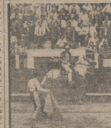
Durante la novillada celebrada ayer, jueves, un espontáneo se lanzó al ruedo. Veámosle aquí en un momento de su corta actuación.