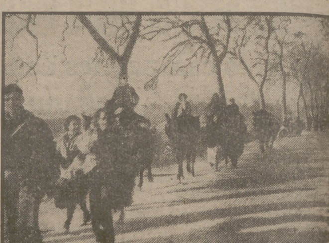
Los familiares de los milicianos fueron obligados a seguirlos en su infortunio.

Así, preguntando severamente el comisario y respondiendo humildemente el doctor Negrín, nos enteramos de que esta mañana fué sorprendido en su hotel por cuatro individuos, quienes haciéndose pasar por enviados del ex-