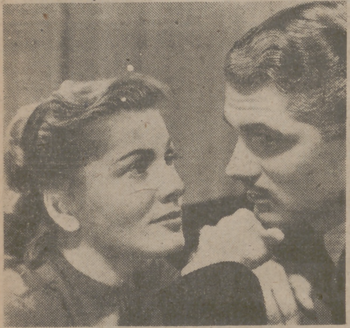
Joan Fontaine y Laurence Olivier en un primer plano de "Rebecca", auténtica joya del séptimo arte. El gran éxito del cine estadounidense, no superado hasta la fecha, vuelve a la pantalla madrileña. Desde el lunes próximo se exhibirá "Rebecca" en el Palacio de la Música.