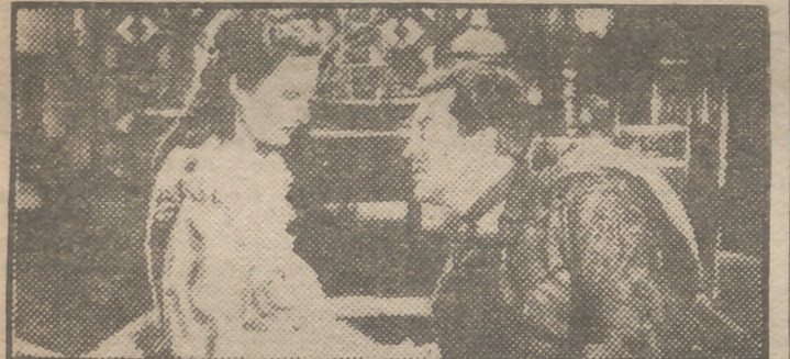
La bellísima Bárbara Stanwyck y el apuesto galán Ray Milland en un primer plano de la extraordinaria superproducción en tecnicolor "California", que, presentada por Cifesa, sigue triunfando diariamente en el Rialto.