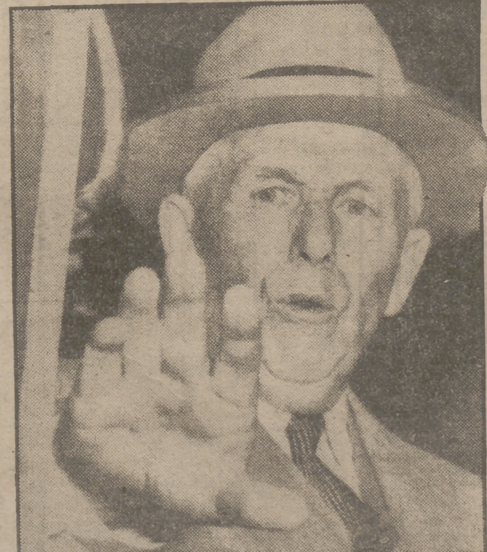
He aquí a Marshall, secretario de Defensa de los Estados Unidos, en una actitud preventiva ante el fotógrafo, a su llegada a la Cámara, el mismo día que dijo al Comité de Investigación en la controversia con Mac Arthur: "Cuidado con la guerra!" Esta amenaza ya por varios lugares del planeta.