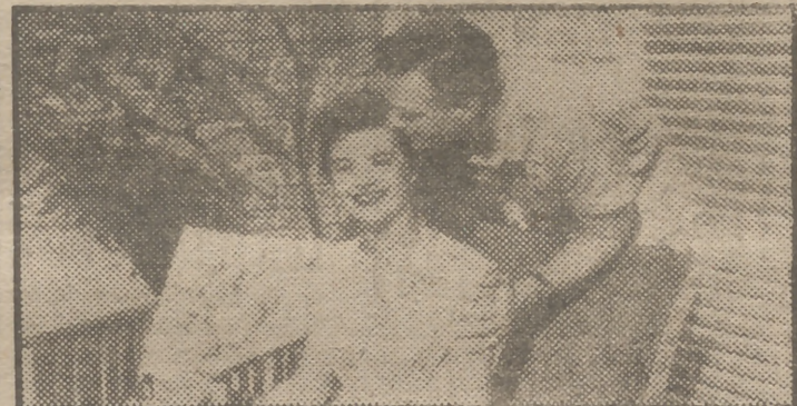
Margaret Lockwood y Paul Dupuis, en una escena de "Odio en la sombra", un hondo problema humano que lleva la emoción a los corazones de los espectadores. Una auténtica superproducción que, presentada por Distribuidora Chamartín, está cosechando diarios triunfos en el Real Cinema.