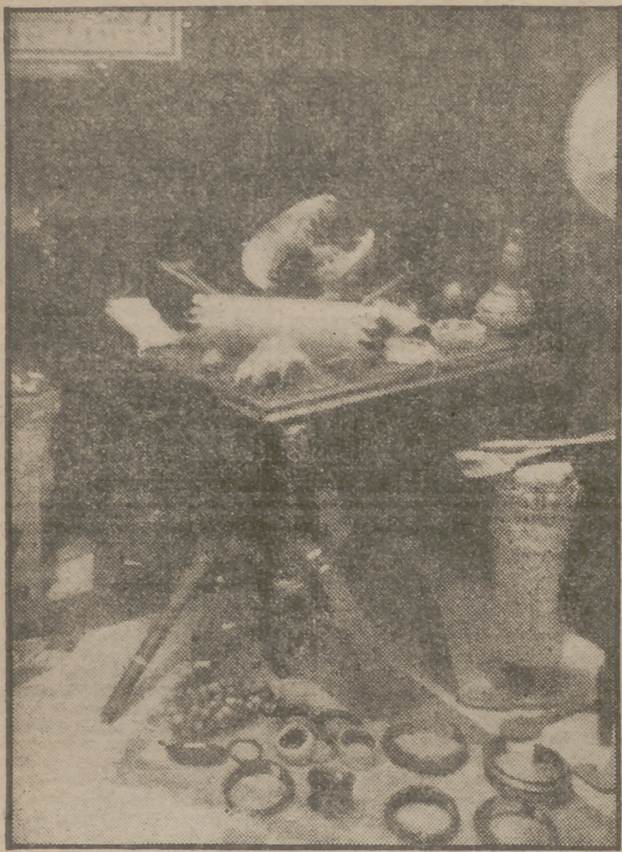
En la Exposición Misional de Africa Occidental Española, organizada por los Padres Claretinos e Inaugurada ayer en la Dirección General de Marruecos y Colonias, figuran piezas diseccionadas, instrumentos, adornos y otros objetos, algunos de los cuales recogemos en esta fotografía, que dan idea al visitante de las condiciones en que se desarrolla la vida en tales territorios y resaltan la función colonizadora de nuestros misioneros.