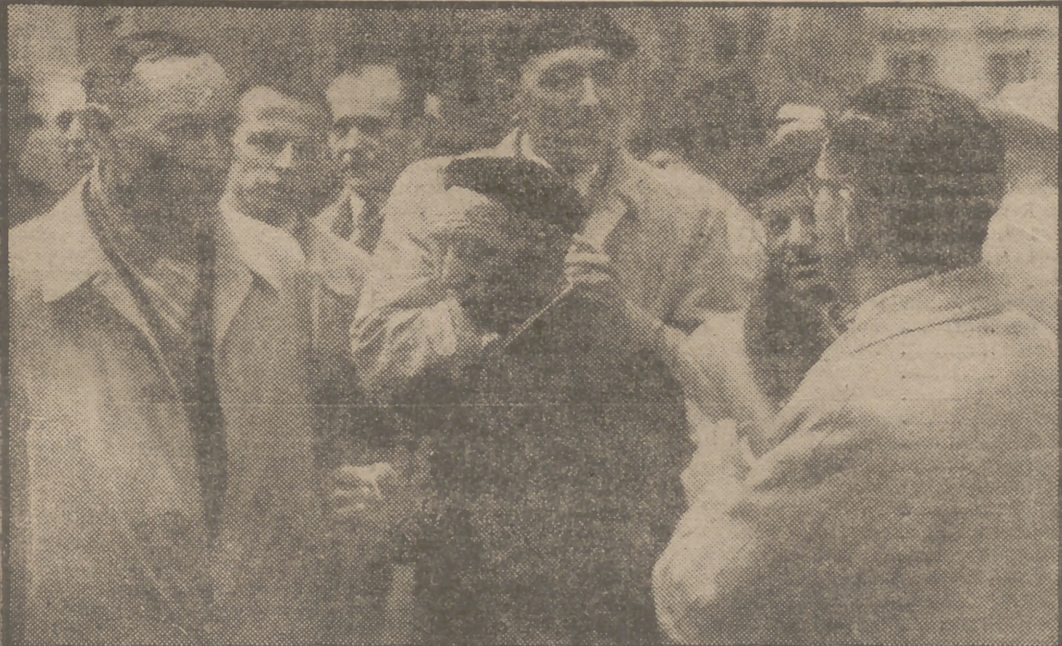
Grupos de representantes de los campesinos españoles cambian impresiones antes de comenzar la sesión de apertura de su Asamblea Nacional.