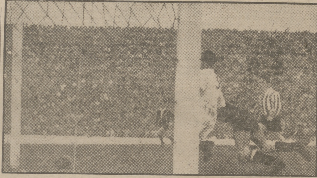
Alonso fuera de su puerta y el balón rondando el gol. El disparo del delantero salió un poco esquinado. Por poco...

En cuanto al motorismo español se cuenta con los principales valores: