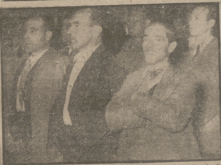
Los delegados campesinos de la IV Asamblea Nacional de Hermandades Sindicales del Campo oyeron esta mañana misa en la iglesia del Carmen, antes de la sesión de apertura celebrada en el teatro Madrid. (Foto Verdugo.)

El Delegado Nacional de Sindicatos, camarada Fermín Sanz Orrio, en la Mesa presidencial de la IV Asamblea Nacional de Hermandades Sindicales del Campo, a la que dirigió la palabra para marcar las consignas y directrices de la importante reunión, que congrega a 3.000 delegados en representación de cuatro millones de campesinos españoles. Los asambleístas interrumpieron con sus aplausos repetidamente el discurso del camarada Sanz Orrio. (Foto Verdugo.)