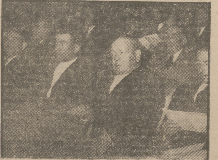
Un aspecto de la sala del teatro Madrid durante la sesión de apertura de la IV Asamblea Nacional de Hermandades Sindicales del Campo.

Junto a los compañeros que representan. Después de insistir en que el éxito y triunfo de esas reuniones de alto valor representativo depende de ellos mismos, aludió a las numerosas disposiciones en las que se recoge el espíritu de las conclusiones aprobadas en asambleas anteriores. Durante su intervención fué interrumpido reiteradas veces por las ovaciones, especialmente al referirse a la fidelidad y lealtad de los campesinos españoles, delimitando los campos en que se siente su influencia en los momentos críticos del país, a los éxitos alcanzados por la ordenación jerárquica de este amplio sector de la producción y a la aten-