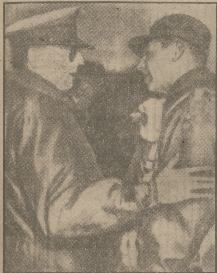
Sigue en primer plano la figura de Mac Arthur. En la foto, el general conversa con su colega Matthew B. Ridgway sobre los posibles planes ofensivos de los chinos. La foto es la últimamente obtenida en el frente, más allá del paralelo 38.

Se calculan en 500.000 los hombres que participarán en la ofensiva roja de primavera