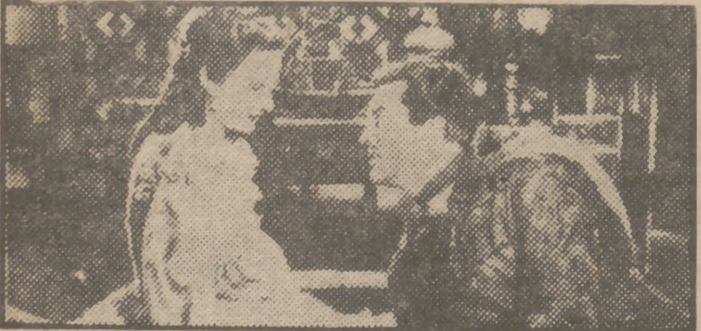
La bellísima Bárbara Stanwyck y el apuesto galán Ray Milland en un primer plano de la extraordinaria superproducción en technicolor "California", que muy pronto se estrenará en Madrid, presentada por Cifesa.