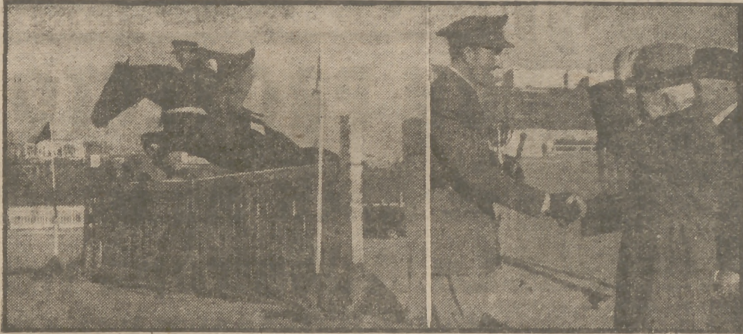
Terminó el concurso de equitación completa celebrado en estos últimos días en Madrid con la prueba de saltos. He aquí un momento de la carrera del vencedor, el capitán Osorio, y a éste recogiendo la copa de triunfador del concurso de manos del general Kirkpatrick.