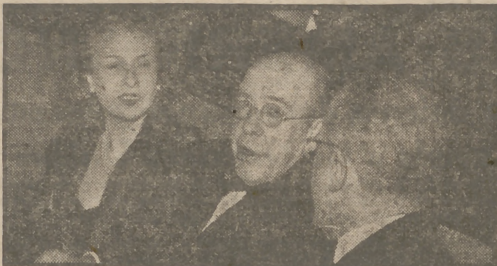
El señor embajador de Estados Unidos y los señores marqueses del Prat, director general para América en el Ministerio de Asuntos Exteriores, que aplaudieron con mucho entusiasmo la maravillosa superproducción de Republic "Arenas sangrientas" (Two Jims), que Floralva sigue exhibiendo en tercera semana de éxito triunfal en el aristocrático cine del Callao.

COMENTARIO: René Clair y París: cine integral. La vuelta a Europa del genial realizador ha traído esta nueva creación de su inquietud y vigorosa personalidad, que trasciende en cada fotografía, en cada imagen, en cada sonido. Y, desde luego, en cada silencio. Es el mejor René Clair de "París dormido", de "Sous le toit de Paris", de "Viva la libertad", de "14 de Julio", que ahora ha querido rendir homenaje a los iniciadores del séptimo arte, cuya capacidad expresiva él mismo cuida de mostrarnos como ilimitada, irradiando siempre hacia nuevos horizontes. La audacia de esta vez ha sido encomendar a Maurice Chevalier un papel fuera del habitual "chansonnier".