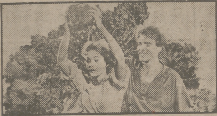
Virginia Mayo y Burt Lancaster en una escena del magnífico film en technicolor, de la Warner Bros, "El halcón y la flecha", que muy pronto se estrenará en Madrid