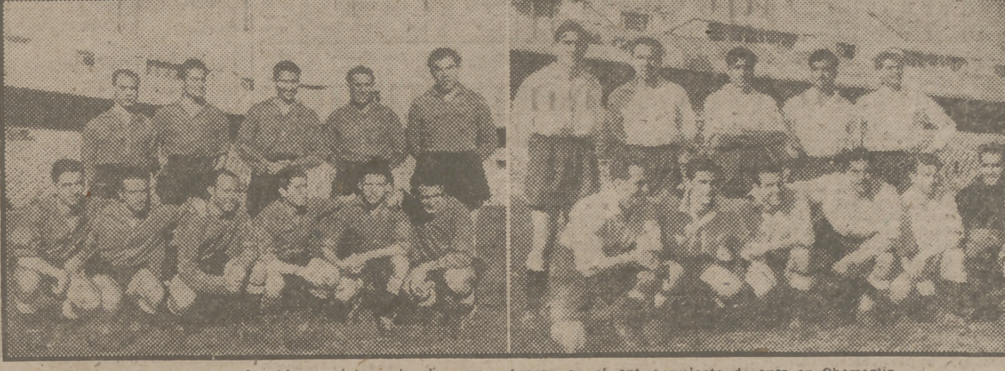
Los azules y los blancos internacionales que actuaron en el entrenamiento de ayer en Chamartín.