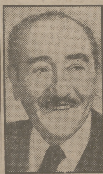
Adolphe Menjou siempre inicia la interpretación de sus roles cinematográficos con entusiasmo y alegría.

"No acostumbro aceptar todos los papeles que me ofrecen—se apresura a aclarar—, pero una vez que encuentro una parte adaptable a mis características, pongo todo mi empeño para representarla."