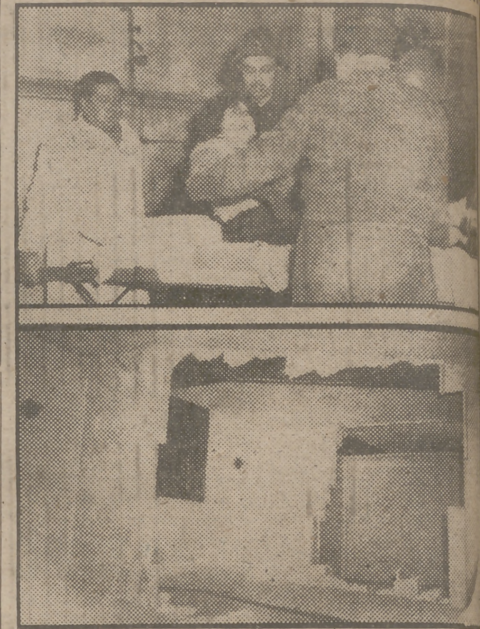
Ocurrió en Roma. El anuncio publicado en la Prensa decía: "Precisase mecanógrafa instruida y seria. Buen sueldo." "Tantas chicas acudieron apresuradamente a la llamada. Las trescientas coincidieron en la oficina, y ocupadas todas las antenas, se apiñaron en las escaleras, pugnando por no perder el sitio de preferencia. Con el peso, la escalera se vino abajo y hubo de intervenir la Cruz Roja para asistir a las numerosas muchachas que resultaron contusas. En la foto de arriba se ve a una de las chicas heridas, que es trasladada en una camilla; en la de abajo se aprecia el destrozo que ocasionó la muchedumbre inquieta.