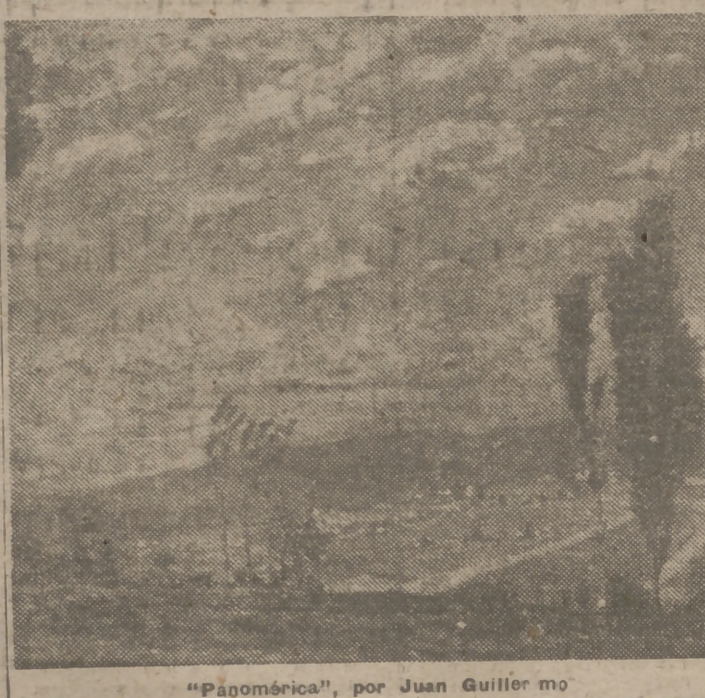
"Panamérica", por Juan Guillermó