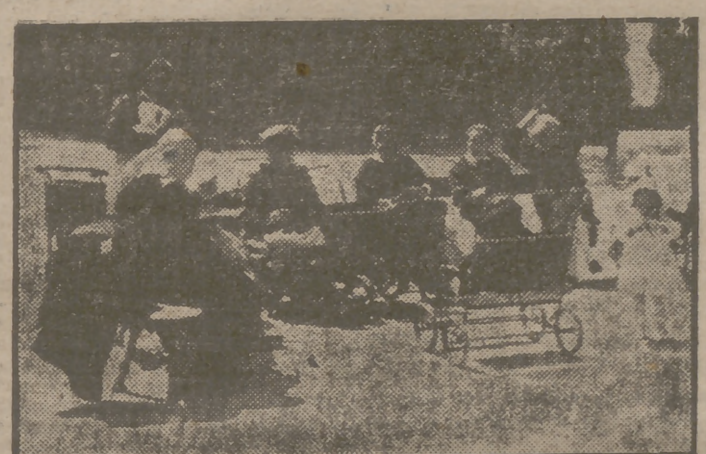
Estamos disfrutando, a Dios gracias, de un tiempo magnífico, que permite a la ohavalería gozar del sol en las plazas y calles madrileñas. El Retiro se ofrece estos días espléndido, y todo parece indicar que la crudeza invernal está próxima a desaparecer. Ello producirá un alivio general en la epidemia de gripe. Milagros del médico Sol.