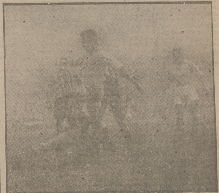
La niebla dió tono británico al encuentro de Liga jugado ayer entre el R. C. Deportivo de La Coruña y el Real Madrid. Pero el juego desplegado por nuestros profesionales no tuvo nada de parecido con el de los "pross" sajones, sino más bien con el fútbol callejero que practican los rapaciños en la playa de Riazor o los chavales en las callejas barriobajeras madrileñas. Por eso no estuvo mal, como resultado, ese empate a un gol