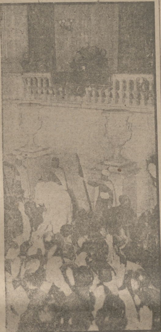
El Jefe del Estado, desde la meseta de la escalera principal del Palacio de Oriente, corresponde a las aclamaciones de los manifestantes que fueron a entregarle las conclusiones aprobadas en la III Asamblea Nacional de Hermandades Sindicales de Labradores y Ganaderos.