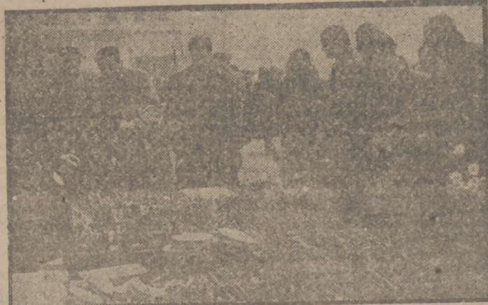
Disipada la niebla, el día amaneció espléndido y con temperatura agradable. En las calles comienzan ya a ser colocados los puestecitos de figuritas para 'Nacimientos, juguetes y chucherías de Navidad. Una de las épocas más bonitas de Madrid es ésta de Nochebuena, y este año parece que se presenta además con tiempo espléndido después de las nevadas de la pasada semana. La plaza de Santa Cruz, la plaza Mayor y las calles de Esparteros, Fuencarral, Torrijos y otras muchas están ya animadísimas, sobre todo a última hora de la tarde, y numerosas personas curiosas ante los tenderetes, en