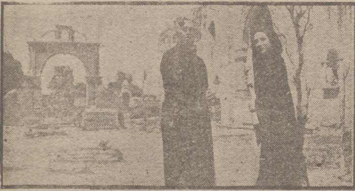
"Rio escondido" es la mejor realización de Emilio Fernández y la más brillante de las interpretaciones de la exquisita actriz María Félix. En la fotografía que reproducimos aparece esta bellísima artista en uno de los momentos más culminantes de "Rio escondido" película que, presentada por Cifesa, triunfa en la pantalla del cine Rialto, en su segunda semana de proyección.