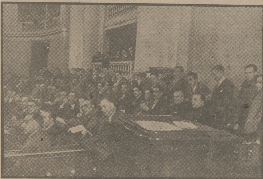
La Comisión denominada "Producción cerealista", durante las deliberaciones en su más reciente reunión en el palacio del Consejo Nacional, donde se celebra la Asamblea del Campo.

Prosigue acerca de premios mínimos remuneradores y cuántos anhelos de aquel Congreso motivaron sus deliberaciones, destacando que discursó tal reunión sobre los principios de fidelidad al Movimiento y de la aspiración a que se modifique la política de intervención con la desaparición de organismos de excepción, que en su día cumplieron una función patriótica, pero que tales funciones, estima, deben pasar a la Organización Sindical y a los organismos permanentes del Estado, con los distingos que cada cuestión, por su índole, aconseje. Subraya el clima moral de fe y esperanza en que transcurrieron aquellos trabajos; ensalza las consignas del Caudillo y ofrece adhesión al mando del Delegado Nacional. Termina con los gritos de "¡Arriba España!" y "¡Viva Franco!", contestados con entusiasmo. (Pasa a págs. centrales.)