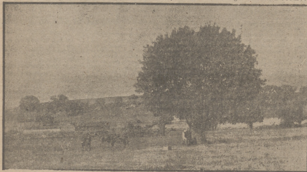
CAMPO CHARRO.—Toro y encina, o sea nuestro regio blasón heráldico, aparecen en esta foto de las dehesas charras