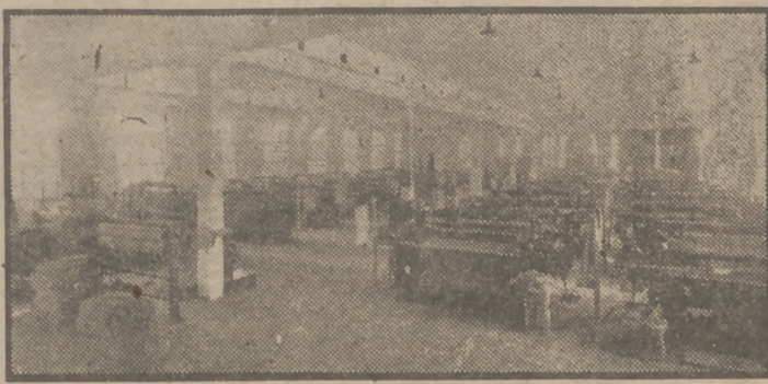
BEJAR.—Un pabellón de la T. E. S. A. Los telares, hoy enjambrados inquietos en la foto, serán ruido, vida y trabajo en los famosos telares bejaranos

Castilla, que lo es por sus castillos, cuenta en Salamanca con ejemplares magníficos, modelos de construcciones civiles medievales. Entre ellos destaca el de Ciudad Rodrigo, bellamente reprimado a la sazón y convertido en para-