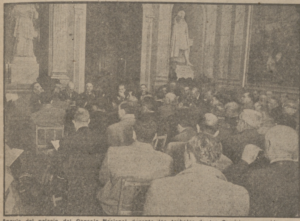
Angulo del palacio del Consejo Nacional durante los trabajos de las Comisiones reunidas por la tarde en el edificio del antiguo Senado.

—¿Cree necesario establecer una entidad de carácter nacional que agrupe a las Hermandades Sindicales Locales y a las Cámaras Sindicales Agrarias? —Existiendo una coordinación de las Hermandades de cada provincia en las Cámaras Sindicales correspondientes, debe deducirse la consecuencia lógica de que estas representaciones provinciales tengan una de ámbito nacional que las abarque a todas. Ahora bien: estos organismos nacionales siempre han adolecido y adolecen de un defecto, y es el de mostrar, su preferencia por determinada provincia o región, cuando el organismo tiene personalidad propia y carácter permanente en su establecimiento y funciones, defecto éste que acusa la ineficacia del organismo nacional, ofreciendo una poderosísima razón en contra de su establecimiento.