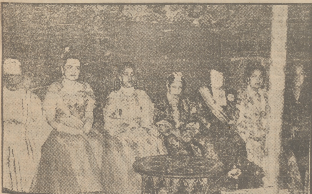
La princesa Lal-la Fatima, que sienta a su derecha a la esposa del alto comisario de España, doña Casilda Ampuero de Varela, acompañada de otras altas damas de Palacio, fotografiada en su tienda, momentos antes de salir para Mexuar, en su noche de bodas.