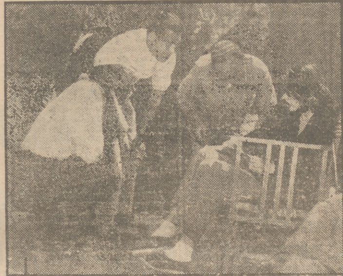
Stromboli: Antes de comenzar una escena del film "Tierra de Dios", un hombre de Rossellini enseña algunas frases italianas a Ingrid Bergman, Julieta enamorada a pie de un volcán.

Sucedió así. Ingrid asistió en Hollywood a la proyección de la más famosa película de Rossellini