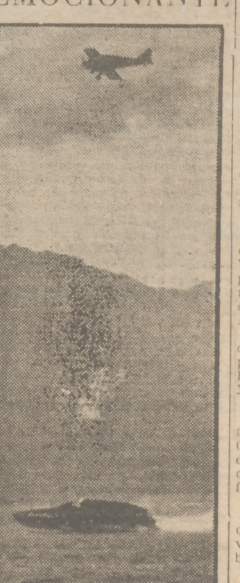
La nave que sin apenas tocar las aguas corre veloz por el lago Maggiore, cerca de Milán, se bate en competencia con el avión por sólo unos pocos segundos.