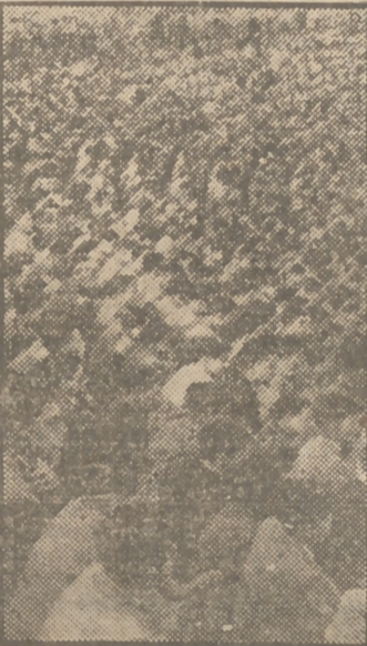
En el campo deportivo barcelonés de Guinardó vemos, en estos grabados, a Su Excelencia el Jefe del Estado, acompañado por el Secretario General del Movimiento, camarada Fernández-Cuesta, en la concentración del F. de J.