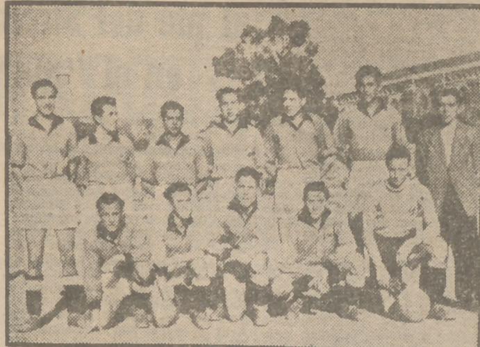
Conjunto del Hogar Delicias Antonio V. Zarza, campeón de Grupo de tercera categoría de Educación y Descanso.

El próximo día 10, festividad del Corpus Christi, se celebrará una interesante prueba de regularidad denominada "Circuito de los Puertos", organizada por el Real Automóvil Club de España. Los vehículos harán un recorrido total de 273 kilómetros, abarcando los puertos de Guadarrama y Navacerrada, en ambas direcciones. Por otra parte, se ha fijado un trayecto de 2.700 metros en el Puerto de Guadarrama, en el que las diferencias de velocidad, a los efectos de clasificación, serán dobles. Las instrucciones pueden formalizarse hasta el día 11 del actual en las oficinas del Real Automóvil Club de España, Ruiz de Alarcón, número 11.