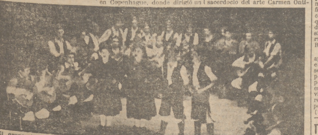
El grupo de baile de Aragón en la fiesta de anoche, final del Concurso Internacional de Canciones y Danzas.

—Llevamos preparadas cuarenta y ocho obras, suficientes para actuar sobre la marcha. O. H.