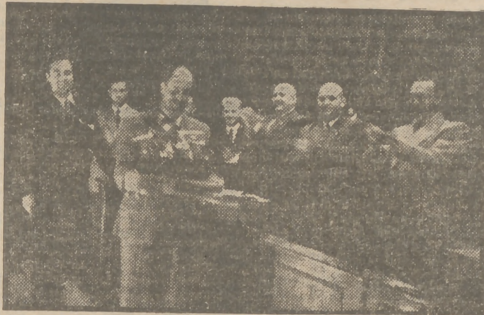
El Delegado Nacional de Sindicatos hace entrega al representante portugués del premio ganado en el Concurso Internacional de Canciones y Danzas.

Si bien todos los representantes de los grupos premiados fueron objeto del entusiasmo del público, este se hizo más ostensible aún cuando le llegó el turno a Portugal. Los diferentes premios concedidos a los parti-