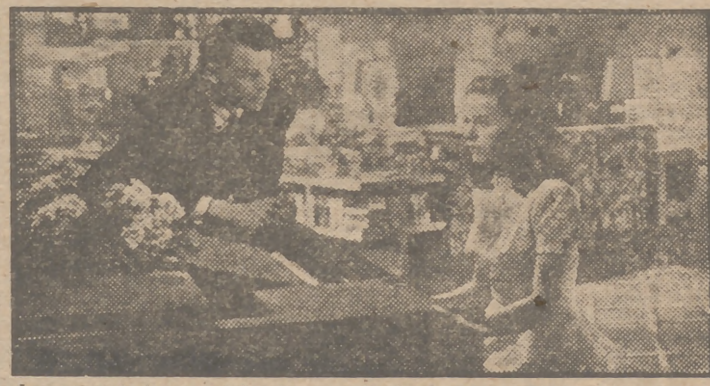
La encantadora actriz Jeanne Crain y el apuesto galán Sornel Wilde, en una escena de la apasionante superproducción de la 20th Century Fox, en tinte color, "Que el cielo la juzgue", el mayor éxito cinematográfico de la presente temporada, que ha entrado en su quinta semana de proyección en el suntuoso Palacio de la Prensa.

Adolecían las famosas películas de "gangsters" de su falta de humanidad por cuanto las figuras biografiadas en las pantallas solían ser seres infrahumanos desprovistos de toda moral y en muchas ocasiones sin la lección final que justificase su presencia en los films. Al acometer Europa, concretamente Italia, la tarea de realizar una película perfecta de "gangsters", se ha preocupado tanto por su forma como por su fondo, exhibiendo, al lado de procedimientos dinámicos y trágicos de los modernos bandidos urbanos, una lección humanística que revaloriza la totalidad. Este es el caso de Esteban el universitario, convertido en asesino, personificado en "Juventud perdida" por Mario Menicelli, último descubrimiento europeo para el cine, cuya presentación ha resultado sensacional. Esta película, intensamente rápida y moderna, será presentada al público español dentro de pocos días por EDICI, la distribuidora cinematográfica de los éxitos.