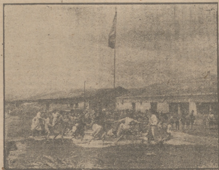
La Granja-Escuela de Talavera de la Reina, provista de toda clase de elementos para la enseñanza en régimen interno de 50 alumnos, cuya residencia, cómoda y confortable, se está terminando para ser inaugurada en breve.

PRACTICA LABOR SOCIAL Desde Naval Moral de la Mata los congresistas se dirigieron al lugar denominado Vega de Mesillas, donde parece no existir otro atisbo de civilización. En este punto es donde la Obra Colonización está realizando una inmensa labor social, no desprovista del notable factor económico, en beneficio de los usuarios. En plan de aparcería viven en aquel poblado un centenar de familias, dedicadas en el valle del Tietar al cultivo y secado de pimentón y tabaco. Según información obtenida, cada aparcerero, en el último año, después de haber vivido él y su familia, ha logrado un beneficio líquido superior a 12.000 pesetas.