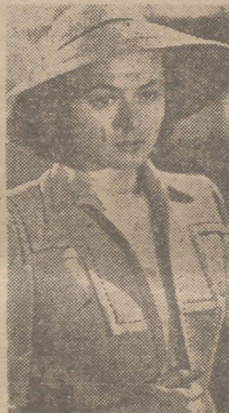
Ingrid Bergman, primera figura del cine mundial, forma la pareja central con Charles Boyer de la superproducción Metro-Goldwyn-Mayer "Arco de Triunfo", que en breve se estrenará en Madrid.