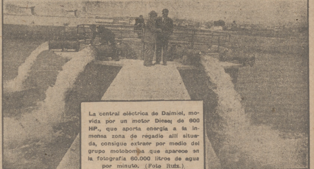
La central eléctrica de Daimiel, movida por un motor Diesel de 800 HP., que aporta energía a la inmensa zona de regadío allí situada, consigue extraer por medio del grupo motobomba que aparece en la fotografía 60.000 litros de agua por minuto.

Desde la explotación de la Vega de Mesillas se efectuó una visita a A'deanueva de la Vera, que dista unos 25 kilómetros del referido lugar, y en cuyo pueblo la Organización de alimentación e higiene, evitando que, como antes, vivieran hacinados en el mismo barracón, que, a la vez de secadero de pimentón y tabaco, constituía la vivienda de aquellos abandonados seres.