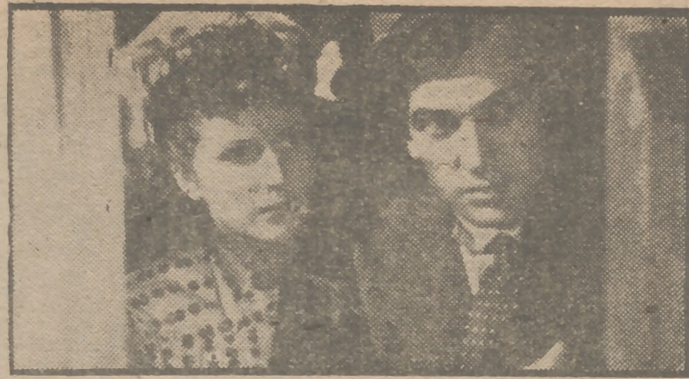
Carla del Poggio y Máximo Giratti en un primer plano de la apasionante superproducción "Juventud perdida", obra maestra de la cinematografía moderna, que Edici presentará en breve en el suntuoso cine Capitol.

Reproducimos una escena de "Nunca la olvidaré", film basado en la obra de gran éxito de Kathin Forbes "I Remember Mama". Esta novela ha sido traducida a todos los idiomas del mundo. Su éxito en Norteamérica fué extraordinario, y no menos en Suramérica. Puede decirse que "Nunca la olvidaré" se trata de una obra maestra del séptimo arte. La bellísima Irene Dunne logra la más feliz de sus interpretaciones en este magnífico film de la R. K. O. Radio, que hoy, jueves, se estrena en el palacio del espectáculo, el Coliseum, naturalmente.