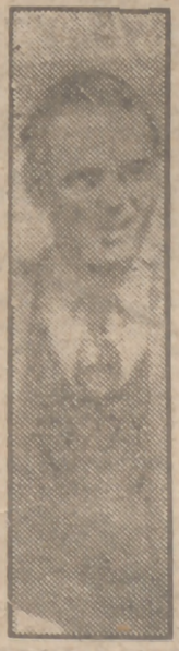
(Pasa a última página.)

—En el Círculo de Bellas Artes. Las secciones que se expongan serán de particulares en su mayoría y sólo se dedicará un pequeño espacio para la industria española.