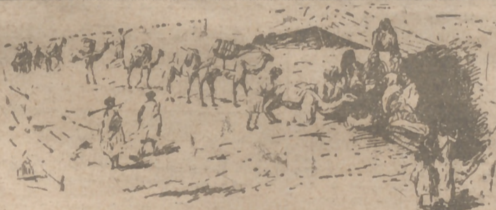
Los "Hijos del Desierto", los tuaregs y otras tribus nómadas, se destrozaban entre sí para robarse sus camellos. Hasta que llegó el general Bens. Este interesante reportaje lo encontrará hoy en nuestras páginas centrales.

Ayer murió el general Bens, el Adelantado del Africa Occidental Española. Con él desaparece una figura ya legendaria en la colonización y pacificación del Sahara.