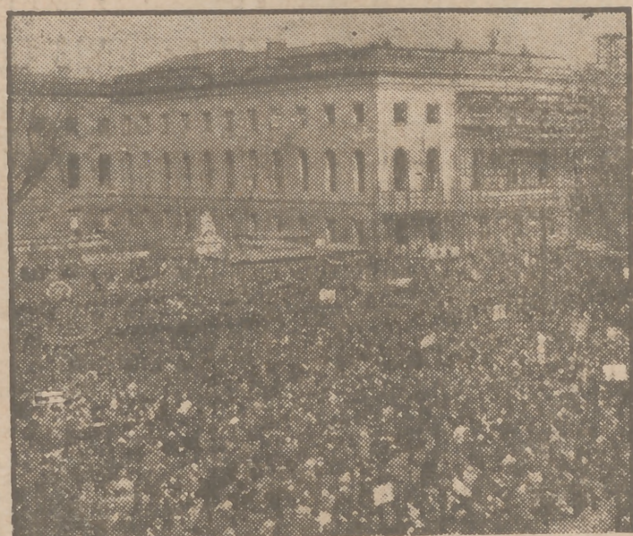
Una concentración comunista se manifestó días pasados en el Unter den Linden, situado en el sector ruso de Berlín, para protestar contra la nueva ley implantada por las autoridades occidentales, que hace al "marco occidental" único valor monetario en los sectores situados bajo el control aliado.