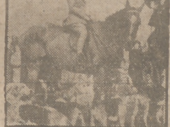
Esta fotografía es una de las más recientes tomadas a la Princesa Margarita Rosa en Badminton, Gloucestershire, (Gran Bretaña), residencia de los duques de Beaufort.