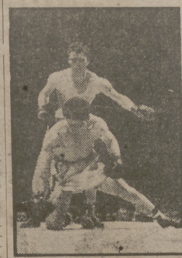
El americano Roland Lasterza bate por fuera de combate al campeón italiano Gino Buonvino, consiguiendo así su trigésima victoria consecutiva.