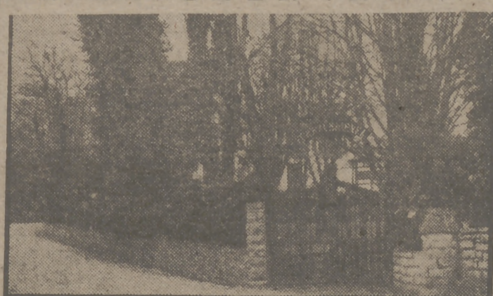
Exteriores de la finca donde se halla enclavado el edificio recientemente adquirido en Fuenterrabía por la Obra Sindical Educación y Descanso, y que será utilizado para albergue de productores en épocas veraniegas.