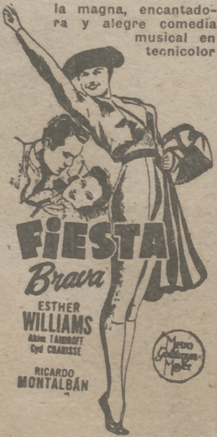
¡Un carnaval de alegría! Amores, canciones, bailes y belleza en el ambiente pintoresco de Méjico

ENTRA EN SU 3.ª semana de éxito, arrollador, presentada por M. G. M., la magna, encantadora y alegre comedia musical en tecnicolor