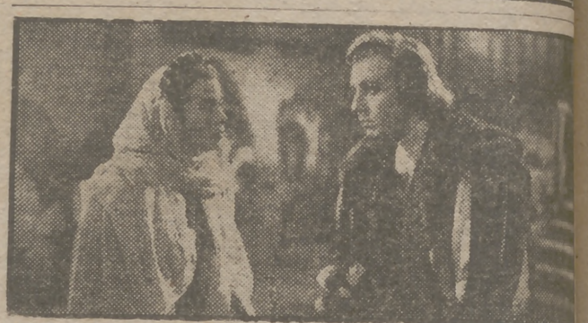
Aurora Bautista y Fernando Rey en una escena de "Locura de amor", la mejor obra del cine europeo, que con el mayor de los éxitos de público sigue proyectándose en los cines Paz, Calatravas y Tivoli.