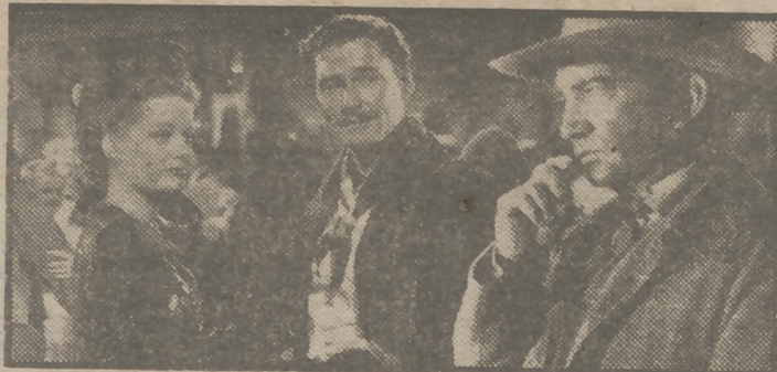
Alexis Smith, Errol Flynn y John Litel, en una escena de la grandiosa producción en tecnicolor de la Warner-Bros "San Antonio de Tejas", que el lunes próximo se estrena en el cine Avenida.

GOYA - BARCELO - GONG 2.ª SEMANA CLARK GABLE - LANA TURNER LA RIVAL DIRECTOR: Mervyn LeRoy