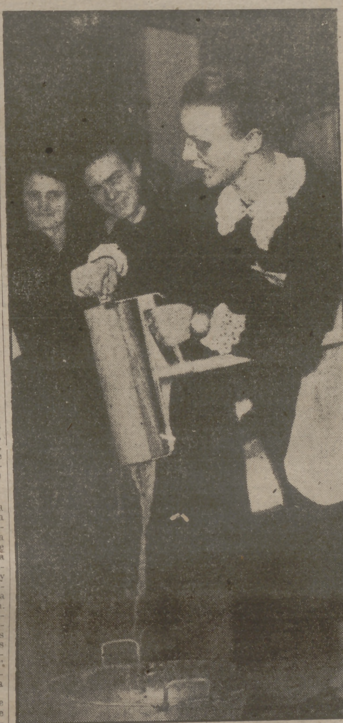
La joven parisina explica con entusiasmo el modo de utilizar el nuevo aparato escoba-fregadora, que evita estropear las manos fregando suelos, y que expulsa el agua sucia con un simple movimiento de manivela. La exhibición práctica está hecha en el XVIII Salón de Actos Domésticos del Grand Palais.