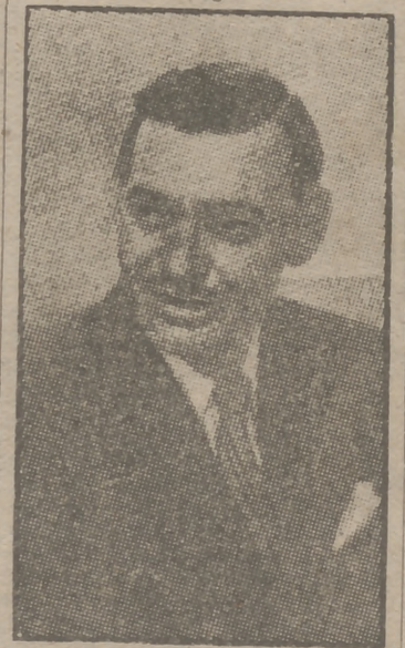
Clark Gable, el idolo de todos los públicos, logra la más romántica de sus interpretaciones, junto a la bellísima Lana Turner, en "La rival", superproducción de la Metro Goldwyn Mayer, que con éxito ascendente se proyecta en los cines Goya, Gong y Barceló.

Paz, Calatravas y Tivoli, y sucesivamente en los mejores locales. "Locura de amor" sigue y seguirá siendo la película sin igual de esta época y de toda nuestra historia cinematográfica.