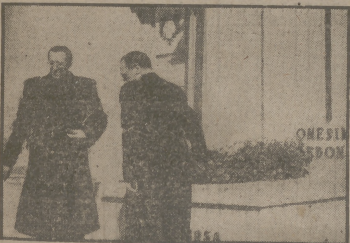
Recogemos aquí varios momentos de los actos conmemorativos de la fusión de F. E. y las J. O. N.-S., celebrados ayer en Valladolid. El secretario general del Movimiento y el ministro de Trabajo depositan una corona sobre la tumba de Onésimo Redondo. El camarada Girón durante su discurso.