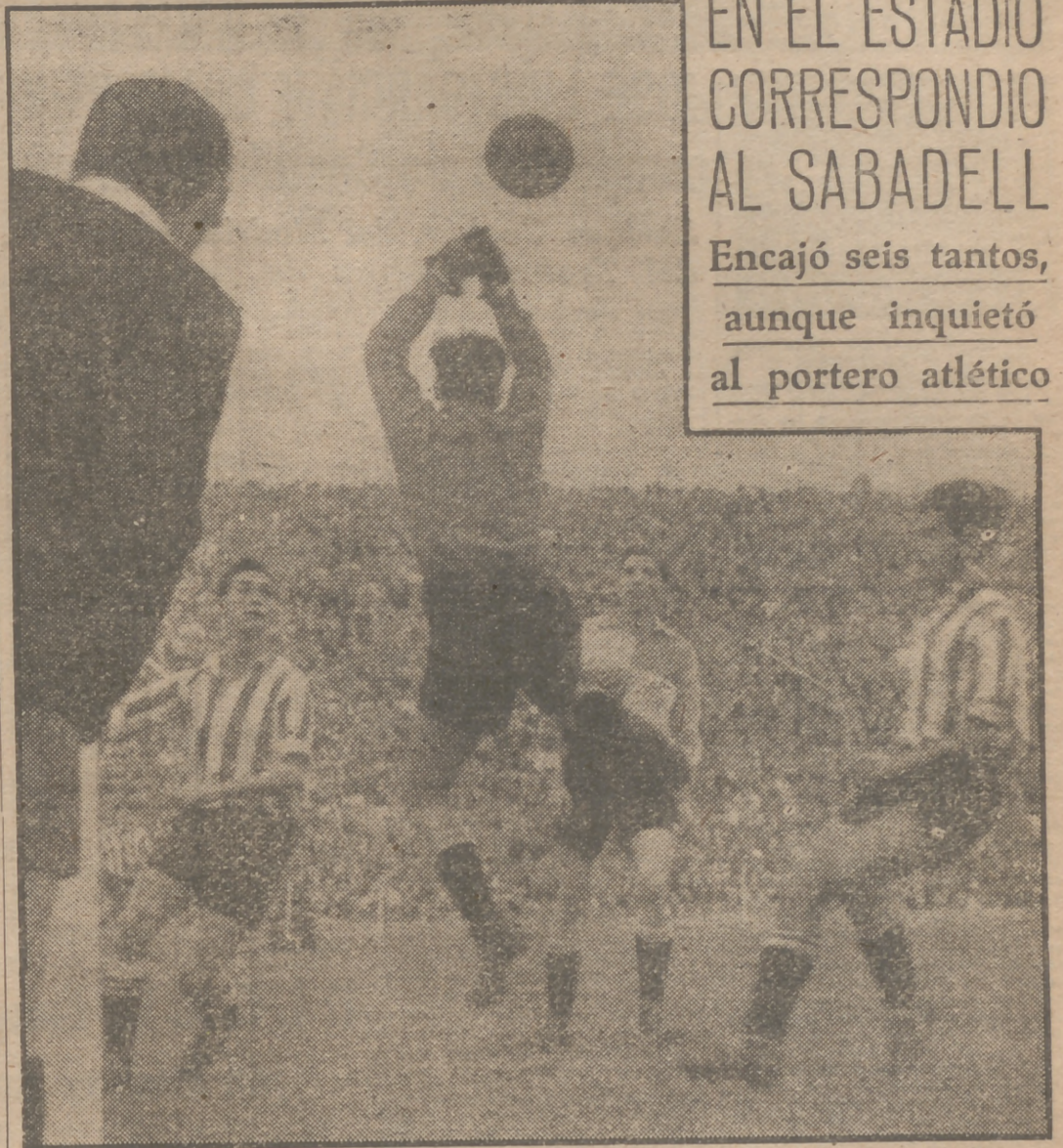
En el Estadio se jugó ayer un partido de los que los aficionados catalogan como de puro trámite. Se oponían sobre el césped madrileño el Atlético, que aún puede aspirar al título, y el Sabadell, colista ya "fijo" del torneo. El resultado (seis-cero) respondió a las previsiones. El Sabadell dejó el rastro de la simpatía y deportividad de sus muchachos. Y su último partido en Madrid en la división de honor, si no consigue salvarle, no se olvidará por ello.

EN EL ESTADIO CORRESPONDIO AL SABADELL Encajó seis tantos, aunque inquietó al portero atlético