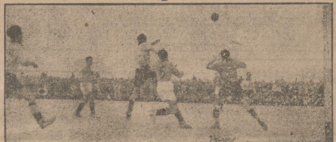
Un ataque del Electrodo a la puerta del Guadalajara en la segunda semifinal del campeonato de Castilla de aficionados, jugado ayer. Este partido se jugó conjuntamente con la otra semifinal (Cuatro Caminos-Rayo) en el campo de la Federación, que registró un lleno imponente. Estos dos últimos equipos deberán jugar un encuentro de desempate