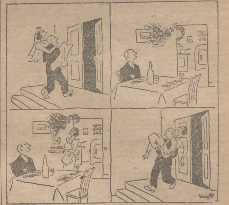
Me aquí una edificante historia muda, pero muy expresiva. El marido lleva a su mujer en brazos hasta su casa. Le corre prisa ver cómo guisa. ¡Mucho humo! En efecto, el consumismo está impensable. Y el caballero—¡oh amor cuñario!—devuelve a su flamante esposa también en brazos.