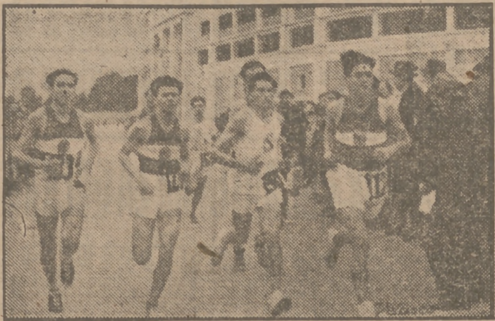
Dos momentos del cross regional de ayer mañana: La salida de las primeras categorías y el paso por la meta cubierta la primera vuelta al recorrido, y en el que puede advertirse la superioridad de Chamartín sobre el equipo blanco.