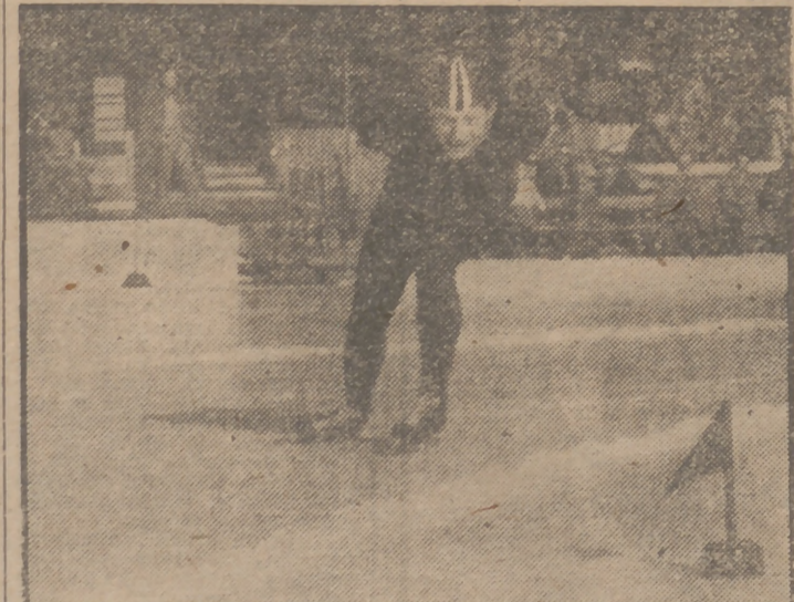
El noruego Hjalmar Andersen, que aparece en la fotografía, estableció una nueva marca mundial de velocidad en los 10.000 metros al cubrir esta distancia en 16 minutos 57,4 segundos, en los campeonatos de Europa de velocidad en patines, celebrados en Davos. (Cifra.)