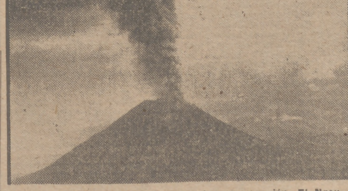
Magnífica imagen del volcán Ngauruhoe en erupción. El Ngauruhoe es uno de los tres volcanes en la región central de la isla del Norte de Nueva Zelanda. El volcán entró en erupción el día 9 de febrero y continuó vomitando lava durante todo el día.