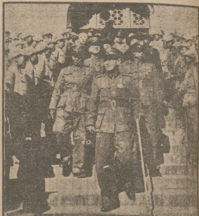
El mariscal Chan, bastón en mano y rostro en el que se refleja el cansancio, la resignación y el hastío, sale del Cuartel General de Nankin, donde declinó sus poderes y delegó en el vicepresidente. Le siguen varios generales y mandos de Estado Mayor. A ambos lados de la escalera los soldados de la guarnición le rindieron los últimos honores presidenciales.

Con todos estos elementos, los aparatos que a tal aeropuerto se dirijan tendrán, tanto para su navegación como para el descanso de a bordo, cuanto necesitan para hacer agradable un descanso de un largo viaje.