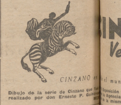
Dibujo de la serie de Cinzano que fue realizado por don Ernesto P. Guinard...

Giornata de El prestigio... por relación... BLANCO... mundial... máximo... ridad... competitivo... cos... como po... Para siempre "U