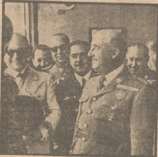
El Jefe del Estado, con el ministro de Educación Nacional, escucha las explicaciones del director general de Regiones Devastadas, conde de Santa Marta de Babilio, en la Exposición de la Reconstrucción de España.

En esta amplia información gráfica recogemos varios momentos de las actividades del Jefe del Estado durante su visita a Sevilla. Así vemos a Su Excelencia en la Exposición de Regiones Devastadas, en la inauguración del Colegio Mayor de Nuestra Señora del Buen Aire, en la de la Escuela de Peritos Industriales y en el santo recinto de los Sagrados Corazones en San Juan de Aznalfarache.