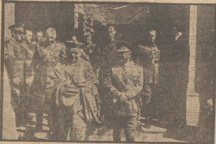
Su Excelencia el Jefe del Estado y el cardenal Segura, a la salida del santo recinto de los Sagrados Corazones, en San Juan de Aznalfarache.

Fueron entregados a Su Excelencia el estandarte, la espada y los anillos simbólicos del Almirantazgo Mayor de Castilla