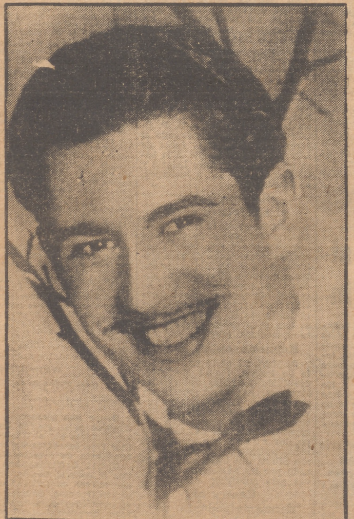
El gran cantor americano Héctor Pontón, que a partir de mañana, miércoles, a las 15,30 horas, actuará todos los miércoles en RADIO MADRID en el programa "Melodías de América", con una magnífica orquesta española.