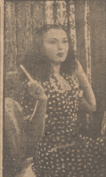
Paquita Rico, primera figura de la canción española, deleitará al público al interpretar las más bellas canciones del folklore hispano en "Manolete", película actualmente en rodaje en los estudios Roptenca para Hércules Films.