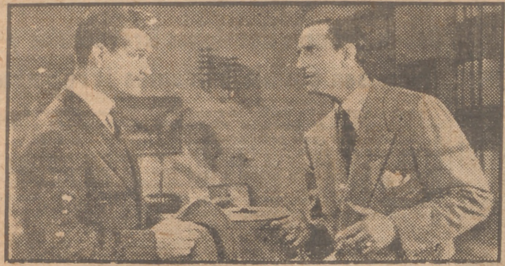
Red Skelton y Basil Rathbone en una escena de la grandiosa producción en tecnicolor "Escuela de sirenas", film que con un éxito inigualable de público sigue proyectándose en el Palacio de la Música.