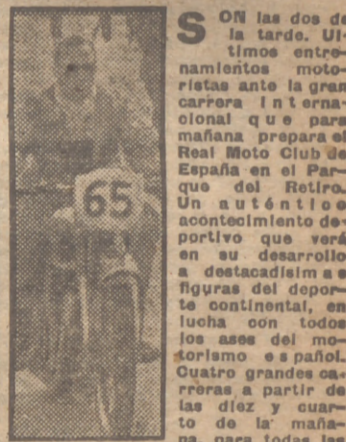
SON las dos de la tarde. Últimos entrenamientos motoristas ante la gran carrera internacional que para mañana prepara el Real Moto Club de España en el Parque del Retiro. Un afortunado acontecimiento deportivo que será en su desarrollo a destacadísima figuras del deporte continental, en lucha con todos los ases del motorismo español. Cuatro grandes carreras a partir de las diez y cuarto de la mañana, para todas las cilindradas y sildecars. Algo que se ve muy de vez en cuando en la vida, porque la presencia del supercampeón británico Easleby y del gran campeón francés Monneret no puede realizarse a menudo. Últimos entrenamientos. Se rueda a una velocidad que llega a los cien kilómetros por hora, que pasa de los cien kilómetros... La corto del circuito y las dificultades que sus curvas encierran no son obstáculo para que los motoristas no realicen verdaderos milagros sobre sus máquinas. Ortueta, el as madrileño, presencia los entrenos de los contrincantes extranjeros. —Son todos grandes deportistas, y mañana el público de Madrid podrá presenciar toda una gran carrera. Debe ser un fijarse especialmente en Monneret, y en particular (Pasa a págs. centrales.)