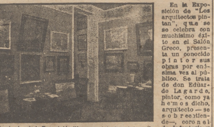
Un rincón de la Exposición "Los arquitectos pintores".

Impresionista, no; impresionable En la Exposición de "Los arquitectos pintores", que se celebra para que los muchos miles de "leñeros" que la han visto regresen a sus pueblos satisfechos del viaje. Y ayer otra vez a los toros, con el olor de que el señor Parra repetirá en la noche del lunes. La Exposición Nacional de Bellas Artes se ve también concurrir. Y la gente se pega por ir esta noche a la fiesta de la Asociación de la Prensa en Pasapoga. Las fiestas de San Isidro han brindado este año una serie de diversiones muy atractivas que permiten al forastero cultivarse por la mañana, emocionarse por la tarde y bañarse por la noche. ¡Hay quien dé más! Muchos euros se dejarán en los miraflores, pero compensados quedarán con la alegría que los días se llevan. ¡Buena! Y no todos los que estamos echando canas al aire somos forasteros. Perdonen ustedes, pero nos vamos a la Plaza... Tristán YUSTE