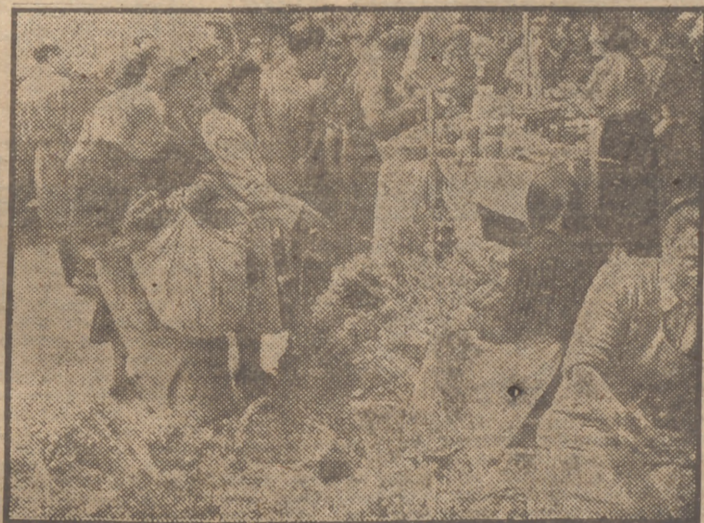
Con motivo de la festividad de San Poncio, Patrono de los herbolistas, se ha celebrado en Barcelona la tradicional venta de plantas olorosas y medicinales, viéndose numerosos puestos al aire libre. La concurrencia de compradores fué extraordinaria.