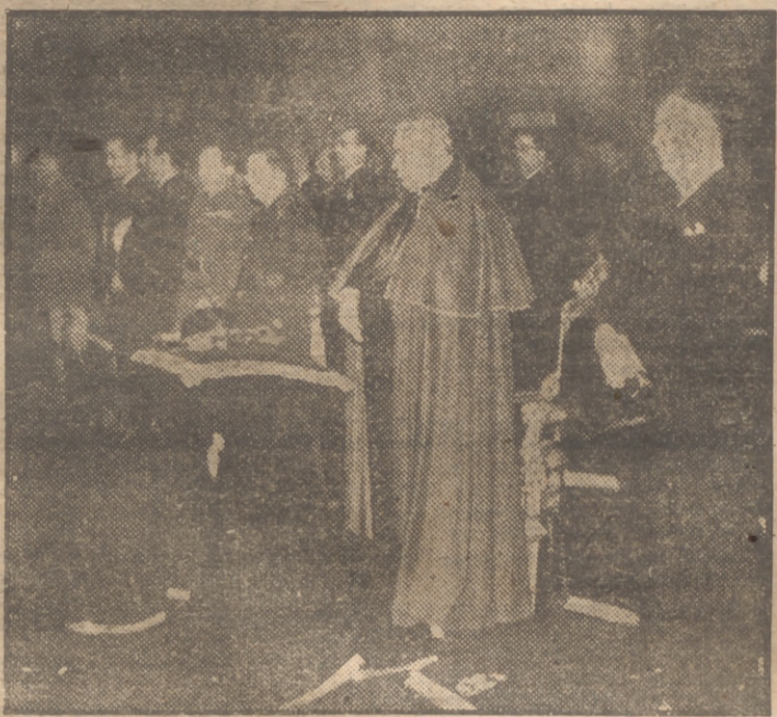
pio de San Francisco el Grande en sufragio por el alma del recientemente fallecido Presidente Rojas, con asistencia del nuncio de Su Santidad, representante diplomático de Filipinas, Cuerpo diplomático y autoridades españolas. Un momento de los solemnes funerales celebrados en el tem

AEROPUERTO de Barajas. Viajeros apresurados de la ventanilla de billetes a la de pasaportes y de ésta a la Aduana. Caneberos de uniforme verdoso vedan el acceso a las pistas. Aquí se encuentran el hombre que acaba de llegar del Cairo y el que espera la llamada: "Señores del avión (Pasa a págs. centrales.)