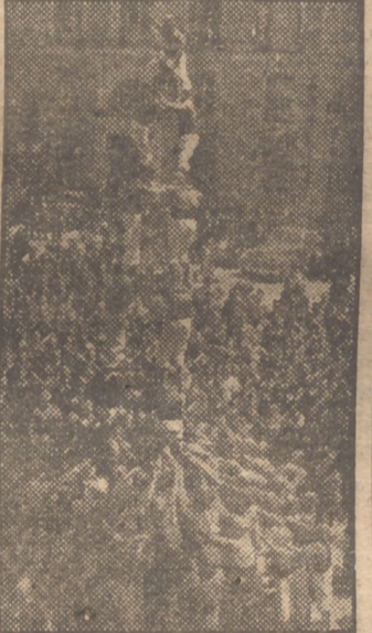
Otro número del programa de las fiestas Isidriales ha sido el de los "Xiquets de Valles", que han hecho gala hoy de su destreza, formando sus famosas torres humanas en la plaza de la Villa.