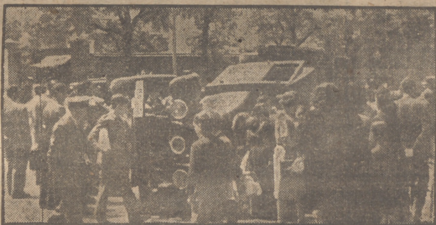
Estado en que quedó la camioneta matrícula M-43055 al chocar contra otro coche en la calle de Goya, esquina a Lagasca, suceso ocurrido hoy. A consecuencia del accidente resultaron dos heridos leves, que fueron trasladados a la Casa de Socorro del distrito de Buenavista. Es lamentable que ocurran estos hechos, motiva a los, en su mayoría, por no respetar los conductores el reglamento de circulación.