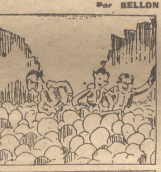
... y el día de corrida grandiosa.

... y el día de corrida grandiosa. —¿A ése! ¡A ése! El epílogo de este suceso ya se sabe: responder ante la Justicia de un delito de robo. TORRE ENCISO