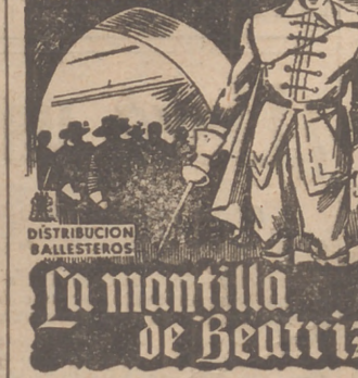
MARGARITA ANDREY ANTONIO VILAR La mantilla de Beatriz DISTRIBUCION BALLESTEROS

Las autoras premiadas pueden presentarse en Mercurio Films, Sociedad Anónima, Sección de Publicidad, de cuatro a seis.