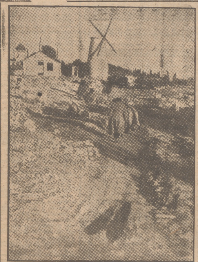
Los Judíos en Palestina tienen que adoptar precauciones para protegerse contra los "pacos" que los acechan cuando regresan a sus casas después de terminada su labor diaria. La foto está tomada en la población de Montifiori, cuyo molino de viento aparece en la foto. Los "pacos" árabes, ocultos detrás de las murallas de la vieja Jerusalén, disparan contra estas gentes, a las que se ve agachadas y aún arrojándose por el suelo para defenderse de las balas árabes.