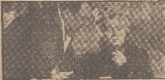
He aquí al formidable actor Edward Arnold a la conquista de su suegra, que es la señora Parkington, magistralmente caracterizada por la exquisita Greer Garson en la película que lleva por título "La señora Parkington", uno de los próximos estrenos del aristocrático cine Callao.