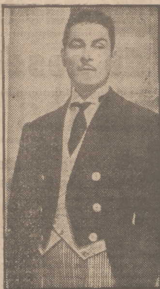
Amadeo Nazzari, el famoso actor italiano tan admirado de nuestro público, es protagonista del jocoso film "Conflicto inesperado", que el lunes próximo se estrenará en el cine Capitol.

El anfitrión, a la hora de los brindis, se levantó para hablar y parodió un discurso de circunstancias con la agudeza y la gracia sobria que sólo un actor de la talla de Nazzari podía conseguir. Hablaron también, unos en serio, otros en broma, Calvo, Ladó y Cid, por los actores; Maruja Asquerino, por las actrices, y varios destacados pe-